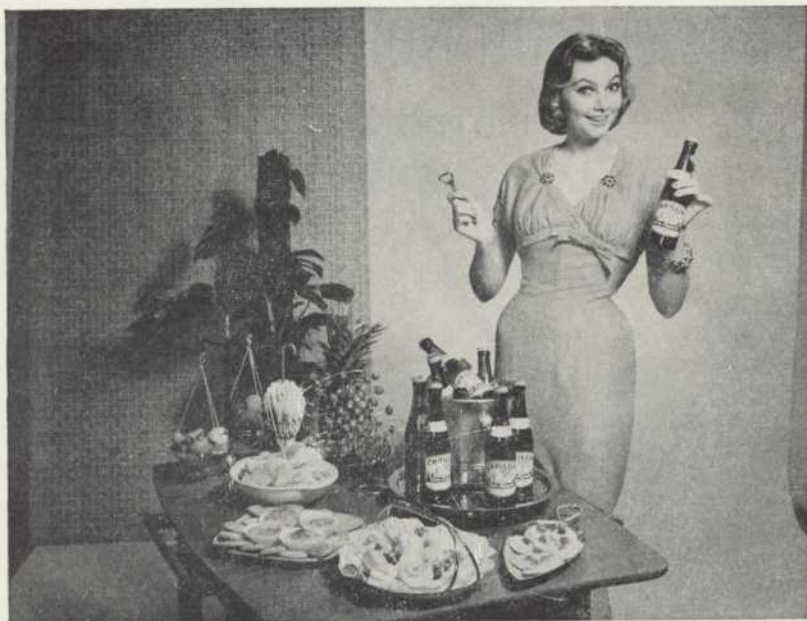
Le breuvage des gens de bon goût