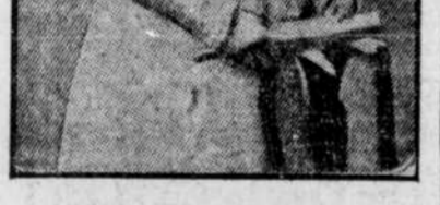
La princesse royale du Danemark qui va être proclamée reine aujourd'hui.

Le roi paraissait être, hier matin, en parfaite santé. Il donna audience publique comme d'habitude tous les lundis. De nombreuses personnes assistaient hier matin à l'audience.