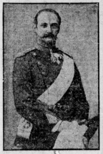
Frédéric VIII de Danemark, qui va être proclamé roi aujourd'hui.

Copenhague, 30 — La note suivante a été communiquée, hier soir, à la presse: "Sa Majesté est morte à trois heures et demie et après-midi. Après que le roi eut accordé ce matin les audiences habituelles, il se mit à table et déjeuna de fort bon appétit. Il ne sembla nullement incommodé. Vers la fin du repas, il se sentit indisposé et se mit au lit à deux heures et demie environ. Sa Majesté est morte doucement; tout indique une rupture cardiaque."