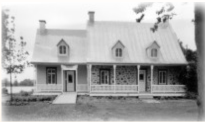
La maison Beaudry

Ce n'est qu'avec l'arrivée du tramway, en 1897, que la paroisse de l'Enfant-Jésus-de Pointe-aux-Trembles (1 299 habitants) commence à s'organiser administrativement et à se développer. Elle est incorporée en village en 1905 et en ville en 1912.