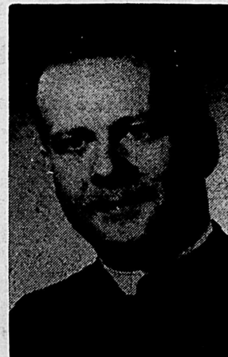
Son Exc. Mgr René Audet, célébrera la messe à l'Oratoire St-Joseph à 20 h. 30 (5 h. 30 p.m.) lors du pèlerinage des diocésains de Joliette le 14 mars prochain.