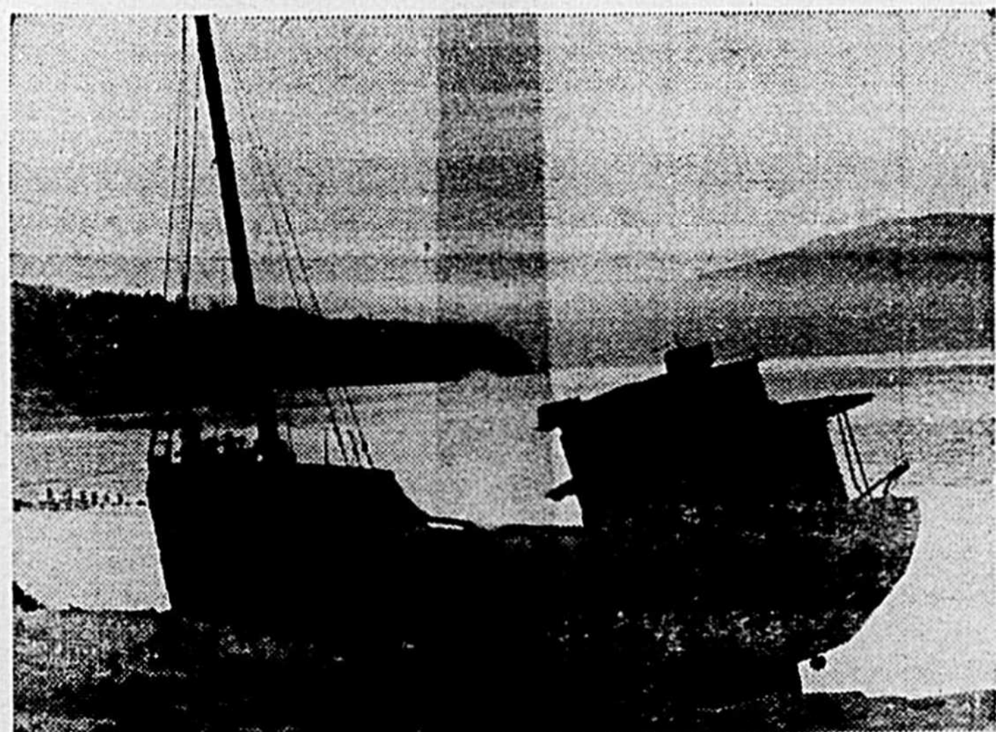
Les Voitures d'eau, le dernier long métrage de Pierre Perreault (de l'Office national du film) depuis le Règne du jour, sera présenté en grande première mondiale au réseau français de télévision de Radio-Canada, le mercredi 19 mars à 20 heures. Ce film nous fait vivre avec une émouvante intensité le drame des habitants de l'Île-aux-Coudres qui assistent, impuissants, à la mort lente de leurs goélettes.