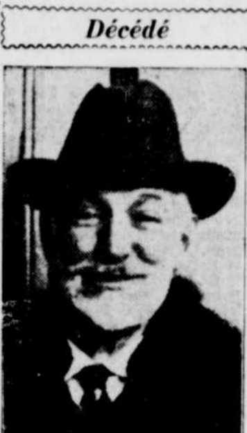
Les Etats-Unis viennent de perdre l'un de leurs plus grands marins dans la personne de l'amiral Williams S. Sims, décédé à l'âge de 77 ans. Originaire de Port Hope, Ont., il vécut dans cette ville jusqu'à 10 ans. C'est alors qu'il partit pour les Etats-Unis. Sims est mort à Boston.

Madrid, 1er (P.C.)— Les défenseurs de Madrid mettent aujourd'hui tout leur espoir dans la ligne des miliciens postés en soutien à Aranjuez, à 28 milles au sud. C'est le dernier rempart devant la capitale. Les rapports officiels disent que l'on n'a plus vu l'armée principale des assaillants depuis lundi dernier, alors qu'elle se trouvait dans les environs de Villa Luenga, sur la route de Tolède à Madrid au sud-est. On croit que cette colonne a changé de direction pour marcher sur Aranjuez. A Ollas del Rey, au nord de Tolède, les miliciens du gouvernement ont de nouveaux subi de fortes pertes par les bombardements aériens et d'artillerie des insurgés. Les autorités civiles annoncent qu'elles ont commencé à évacuer les orphelins de guerre et les enfants des combattants du front, à Valence et à d'autres endroits de la côte méditerranéenne où ils sont en sûreté. Des dispositions sont aussi prises pour l'évacuation de tous les citoyens qui désirent quitter la capitale. Des permis spéciaux sont préparés qui leur permettent de traverser la zone des armées. Le communiqué de ce jour annonce des engagements sur plusieurs points des fronts nord et sud, avec des alternatives de gain et de perte.