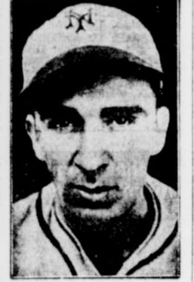
Carl Hubbell, le plus fameux lanceur de nos jours, qui a lancé une magistrale partie, pour donner la première victoire de la série aux Giants. Son triomphe d'hier, porte à 17 le nombre de ses victoires consécutives, cette année.

New-York, 30. Le fameux Carl Hubbell a remporté les honneurs de la première joute de la Série Mondiale, qui s'est disputée aujourd'hui au Polo Grounds, par une température pluvieuse. Le score final a été de 6 à 1. La supériorité que les Giants ont montrée sur leurs rivaux dans les sept dernières manches a incité plusieurs fervents du baseball à choisir les Giants comme les champions du monde de 1936.