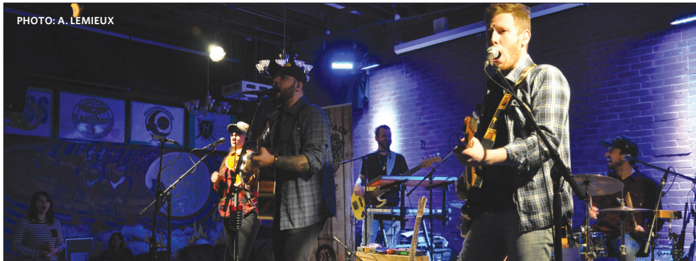
Le groupe Lendemain de Veille à leur deuxième performance en terre trifluvienne.