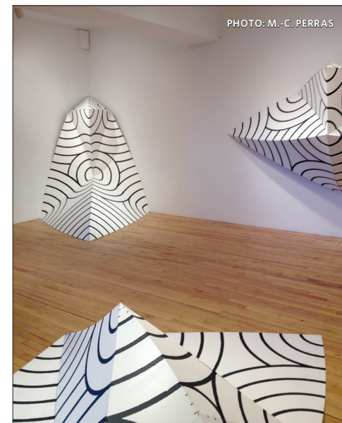
Une dizaine de sculptures mathématiques se partagent l'espace galerie de l'Atelier Silex.

Ces mystérieuses œuvres sont basées sur des principes scientifiques. Entre mathématiques et météorologie, les courbes et les pointes évoquent autant des principes géométriques que