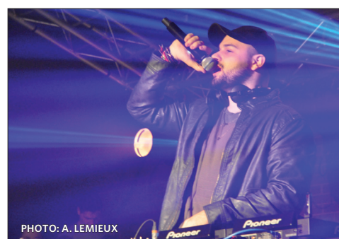
Gazzo a manifestement fait l'unanimité avec sa musique électro house.

Cela dit, les deux types de spectacles présentés semblent avoir charmé les étudiants, qui reprenaient possession de leur université. L'énergie et l'ambiance étaient palpables, ce qui démontre que l'AGE UQTR a visé dans le mille. La présentation de la soirée était commanditée par Vidéotron, présent sur place avec son Boomlab, qui misait sur la découverte de musique illimitée.