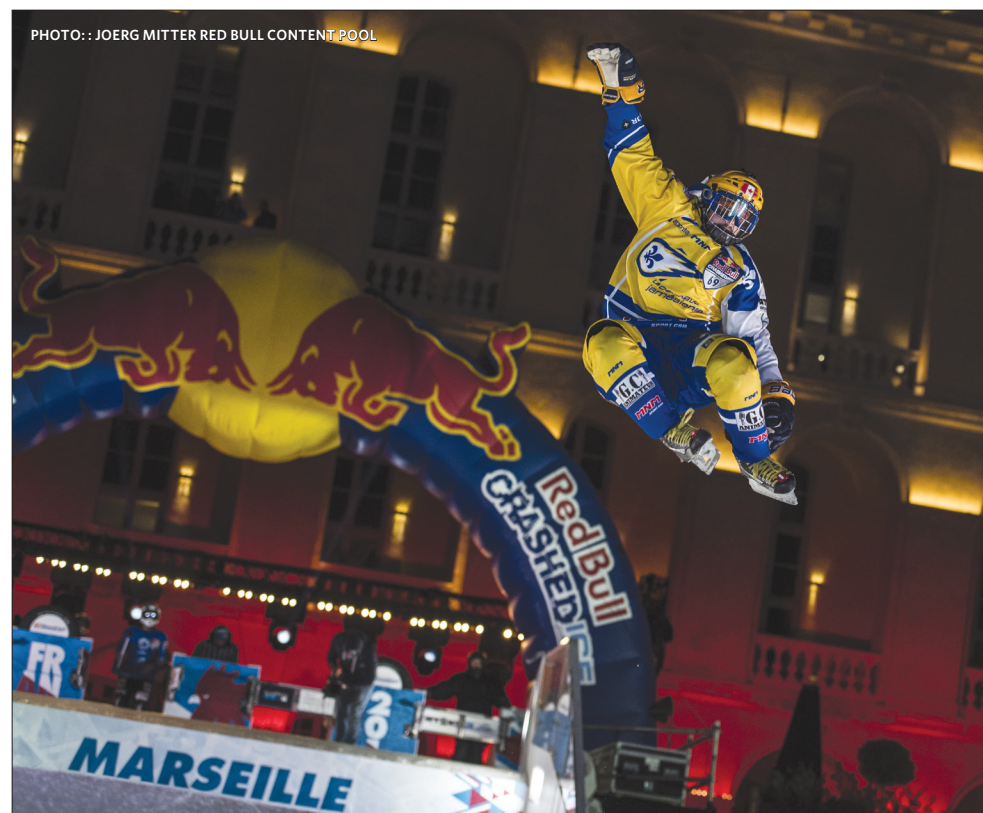
Lors de sa compétition à Marseille, il a obtenu 21 points au classement général.