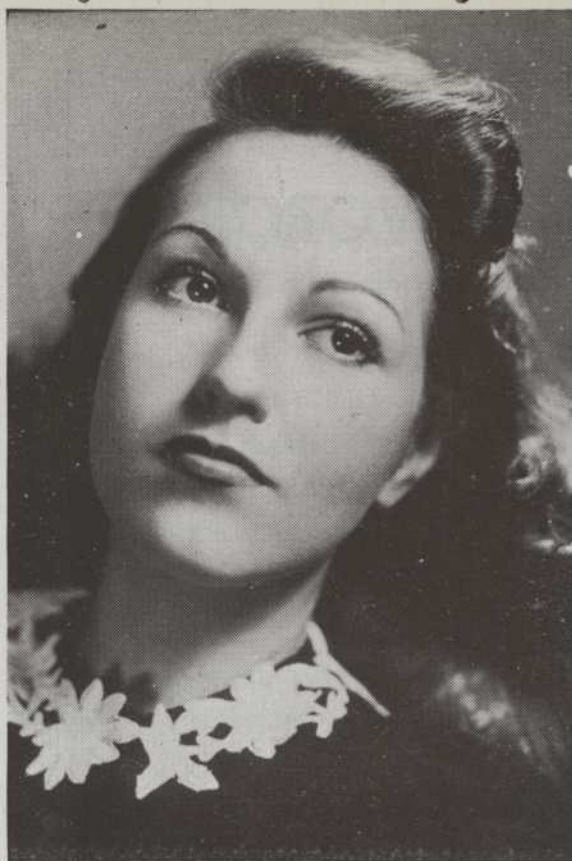
Mlle Janine Sutto