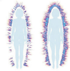
Champ magnétique avant et après l'utilisation de CEF