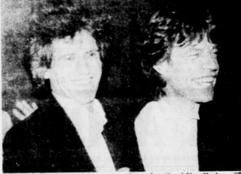
Keith Richards et Mick Jagger, lors d'une réception à New York.