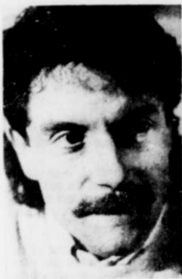
Le Soleil, Jean Vallières Autre chose malgré l'étiquette de chanteur de ballade.

Cabrel s'est donc promis de ne plus refaire le même disque dans le même univers musical. Ainsi,