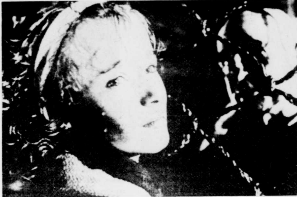
Scène de "The Element of Crime": la naissance d'un réalisateur fascinant, le Danois Lars von Trier.

◆ Il faut surveiller de près dorénavant l'auteur de ce film fascinant qui, à son premier long métrage, a renversé les publics spécialisés de Cannes (Grand Prix de la technique) et d'Avoriaz (sélection officielle). Il est Danois, il avait 28 ans lors du tournage de "The Element of Crime" et il s'appelle Lars von Trier. C'est de la graine d'Orson Welles matiné de Raoul Ruiz et de Jean-Jacques Beineix. Rien de moins.