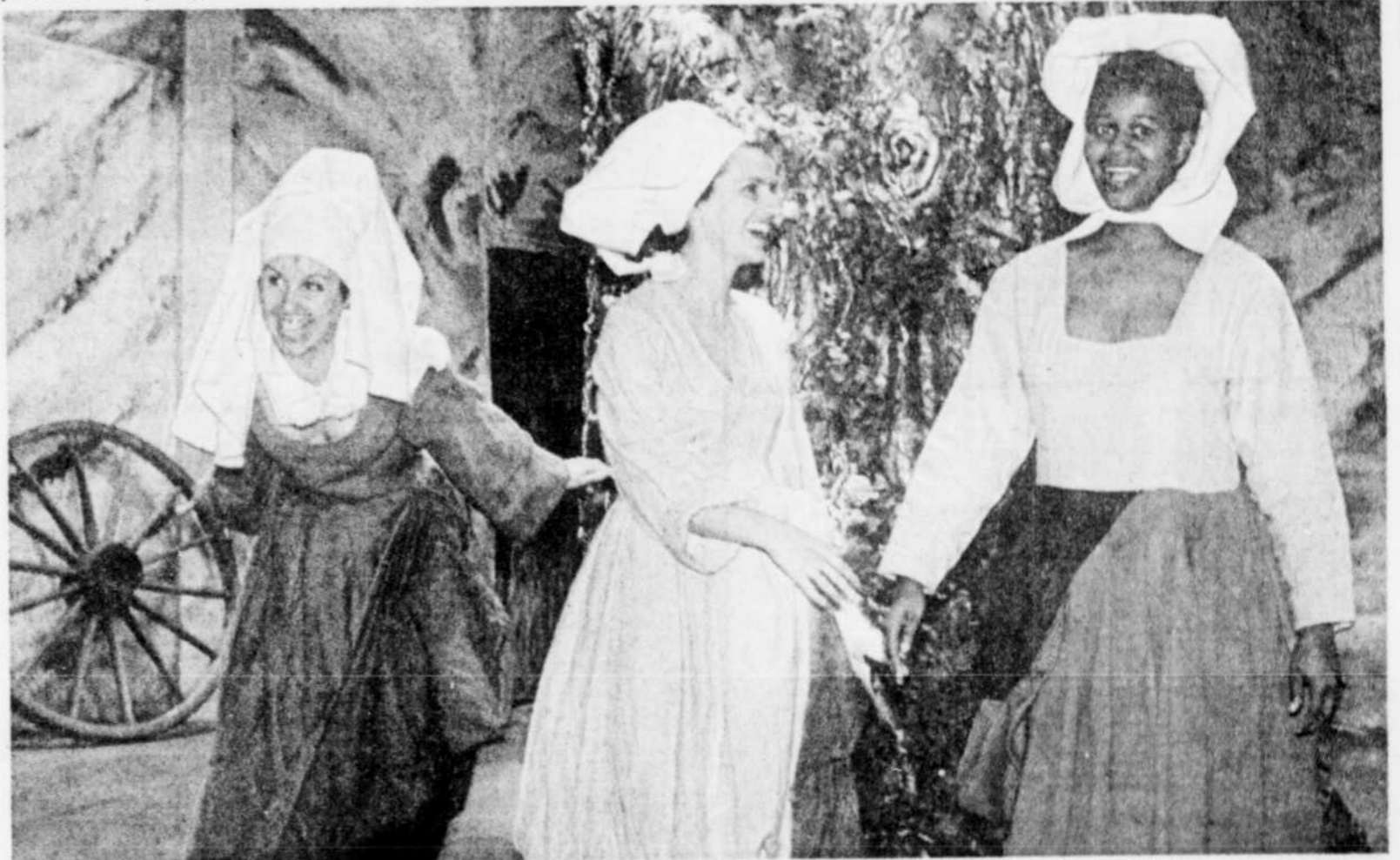
Les joyeuses commères de Windsor s'amuse du bon tour qu'elles vont jouer au pauvre Falstaff, dans cette scène de la production du chef-d'oeuvre de Verdi par l'Atelier d'opéra de l'université Laval.

Cette ultime création de Verdi pour le théâtre lyrique sera donnée et présentée, comme il le souhaitait, tel un opéra de chambre, tel un opéra mozartien. Par sa structure, ses nombreux ensembles — notamment cette fugue à dix voix du dernier acte d'une