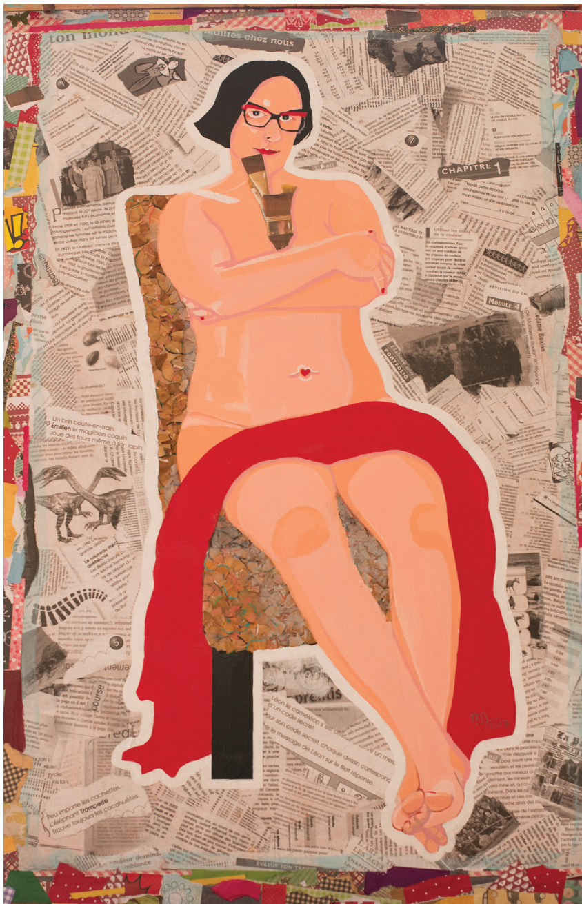
Titre : Mes pinceaux Format : 24 po x 36 po Technique : Technique mixte sur panneau de bois Prix : 300 $