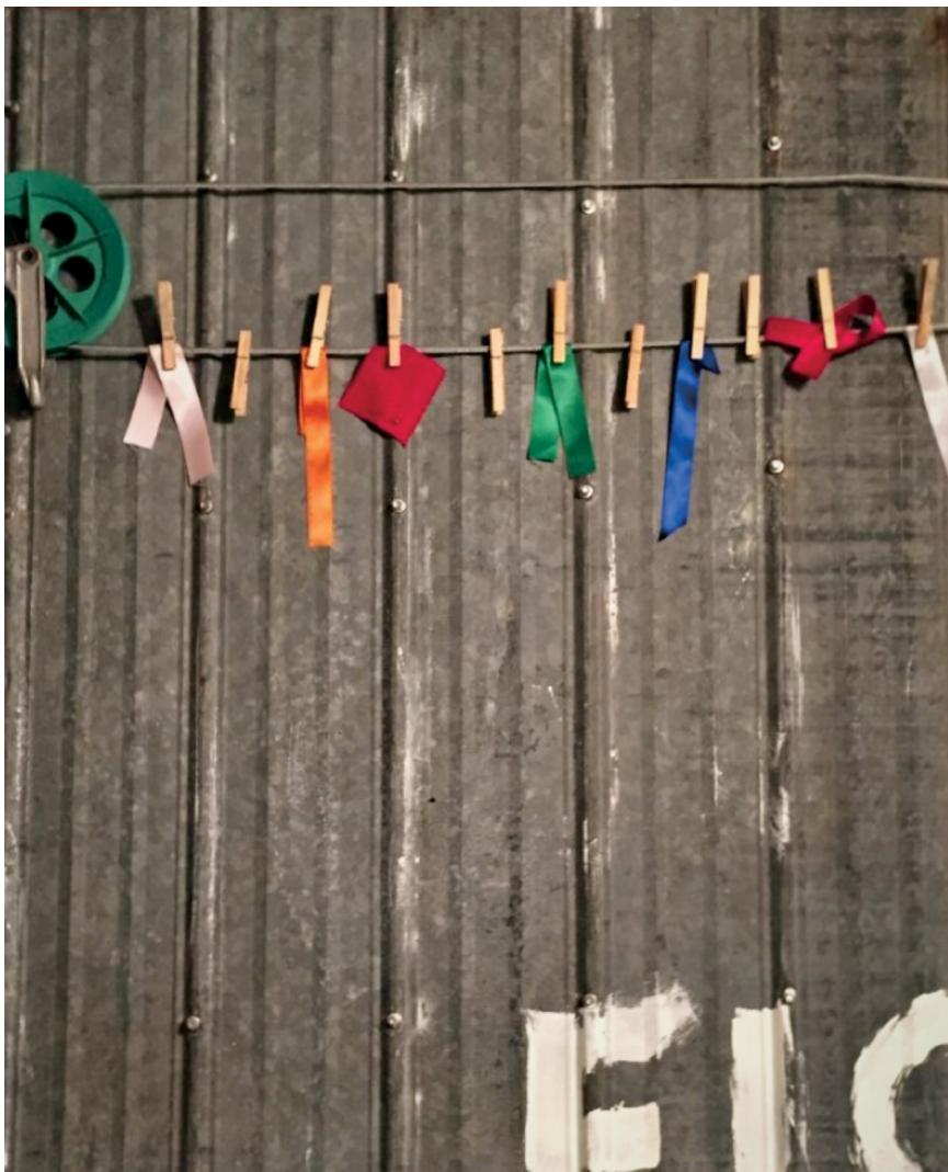
Titre : Couleurs sociales Format : 30 po x 40 po Technique : Assemblage sur tôle, bas relief Prix : 350 $