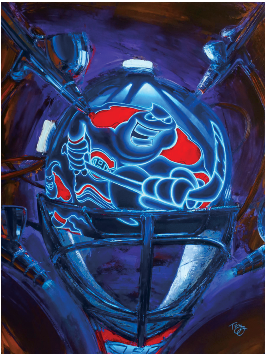
Titre : Ice Pistols Format : 30 po x 40 po Technique : Acrylique sur toile Prix : 2 000 $