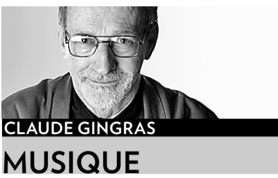
CLAUDE GINGRAS MUSIQUE

J usqu'aux oreilles / Up to Your Ears», le petit festival de musique actuelle présenté chaque été par Innovations en concert à la Christ Church Cathedral, se poursuit chaque soir à 19h30 et se terminera samedi soir à 17h. Rappelons que ces concerts durent une heure, sans entracte, et sont présentés sans frais d'entrée.