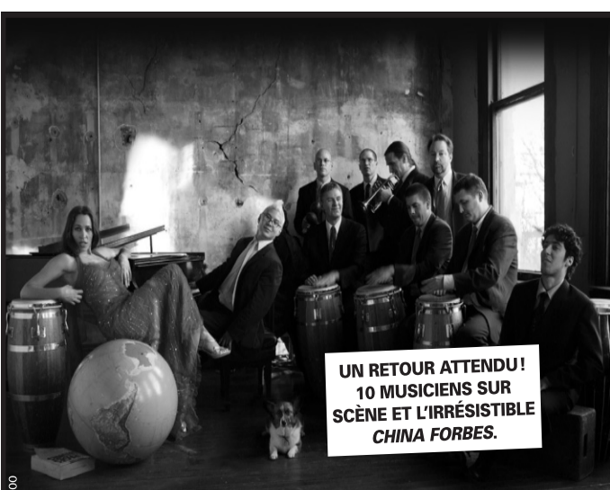
UN RETOUR ATTENDU! 10 MUSICIENS SUR SCÈNE ET L'IRRÉSISTIBLE CHINA FORBES.