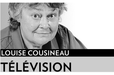
LOUISE COUSINEAU TÉLÉVISION

Je suppose qu'il n'y a pas un seul homme sur terre qui n'a pas rêvé d'être polygame. Ils ne l'avoueront jamais, mais c'est vrai. Pour eux, la série dramatique Big Love , qui commence demain soir à Super Écran à 21 h, sera une réalisation de leurs fantasmes.