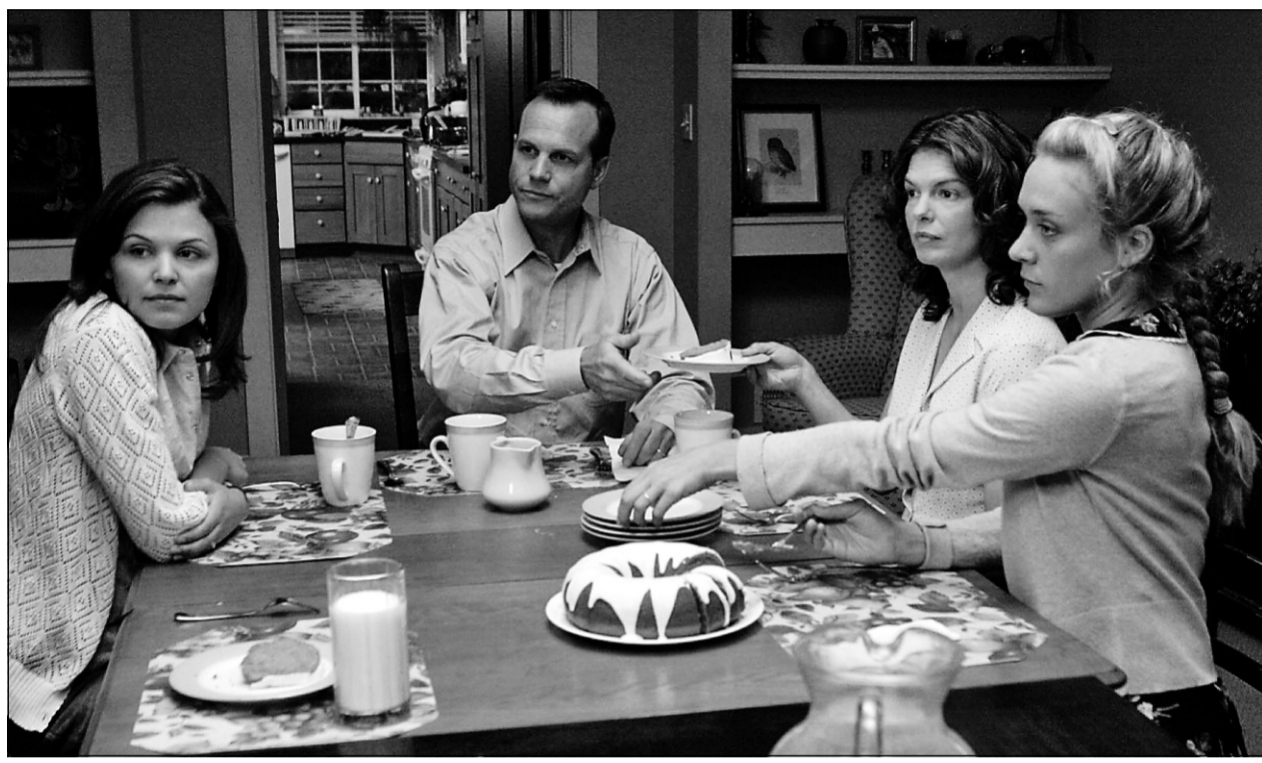
Elles sont trois à se partager les corvées ménagères et... Bill, leur mari. La série Big Love , présentée à compter de demain à Super Écran, risque de plaire aux hommes !

Le premier épisode vous montre l'univers de ce pacha des temps