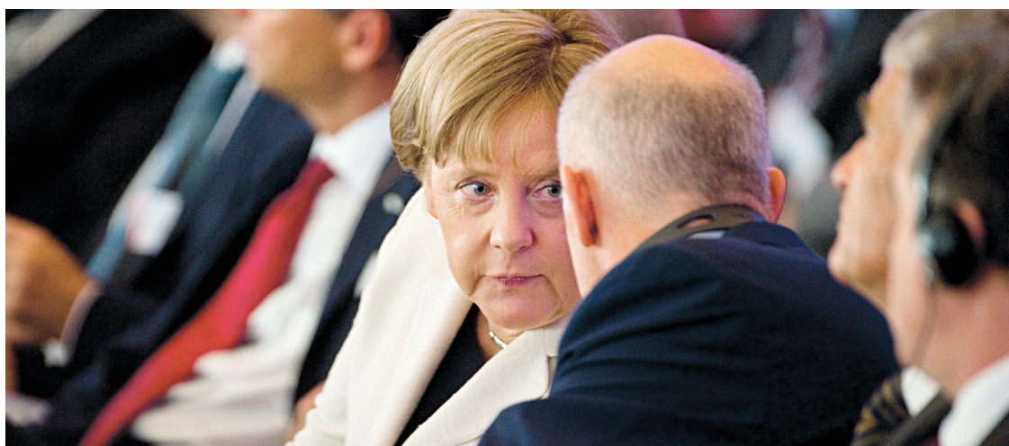
La chancelière allemande, Angela Merkel, et le premier ministre de la Grèce, Georges Papandréou