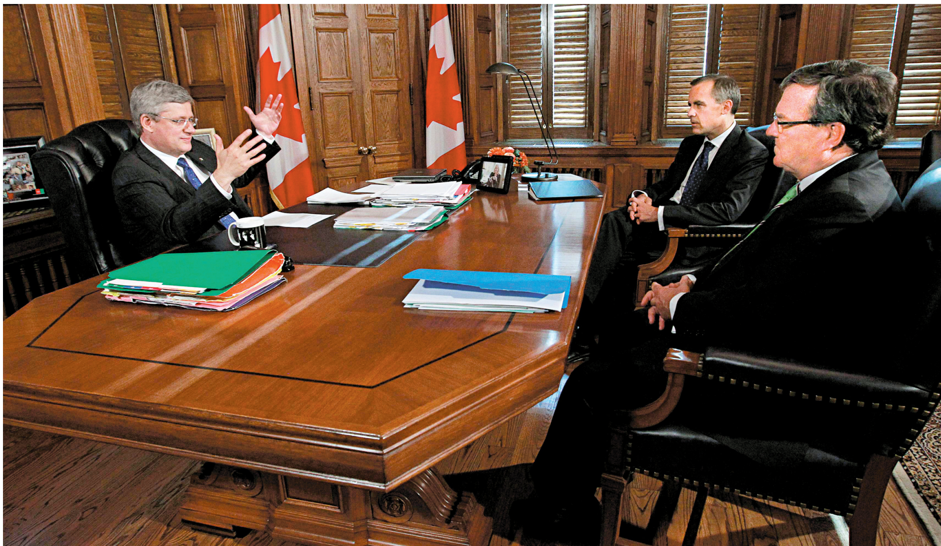
Le premier ministre, Stephen Harper, et son ministre des Finances, Jim Flaherty, ont reçu le gouverneur de la Banque du Canada, Mark Carney, pour discuter de la situation économique au pays et dans le monde.

Stephen Harper fait le point avec son ministre des Finances et le gouverneur de la banque centrale