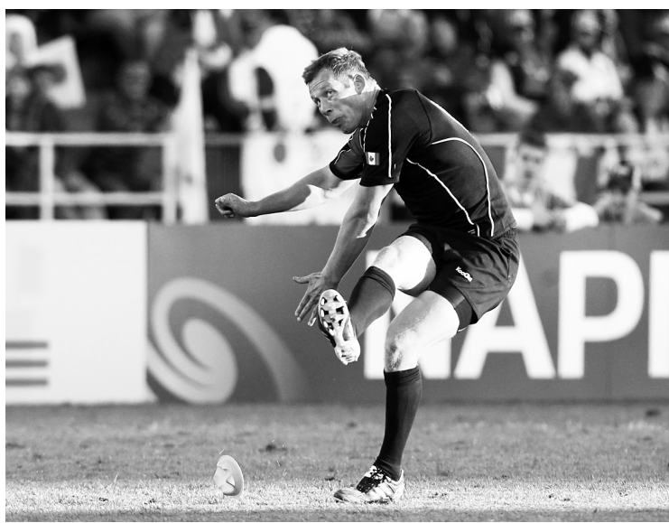
DAVID GRAY REUTERS

Ander Monro a réussi un coup de pied de pénalité pour permettre au Canada de soutirer un verdict nul de 23-23 au Japon, hier.