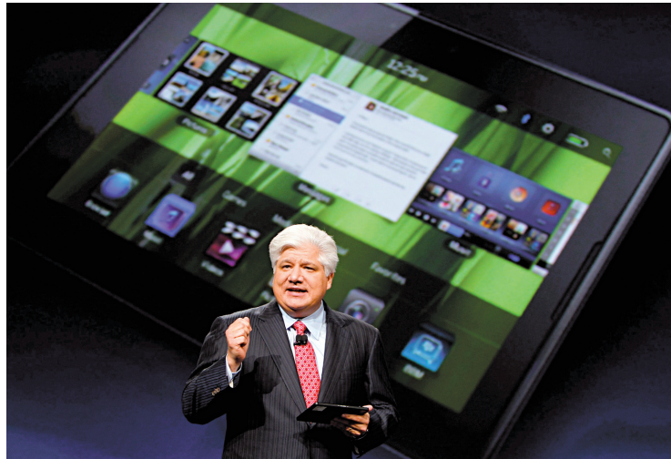
Mike Lazaridis, président de RIM

La pression sur RIM s'est accentuée depuis la publication de résultats trimestriels décevants. Un actionnaire minoritaire, Jaguar Financial, a récemment exigé des changements majeurs ou même une vente de l'entreprise. Le cours de Bourse de RIM a chuté de quelque 60 % depuis le début de l'année. RIM a déjà dominé le marché des téléphones intelligents, mais ses parts de marché se