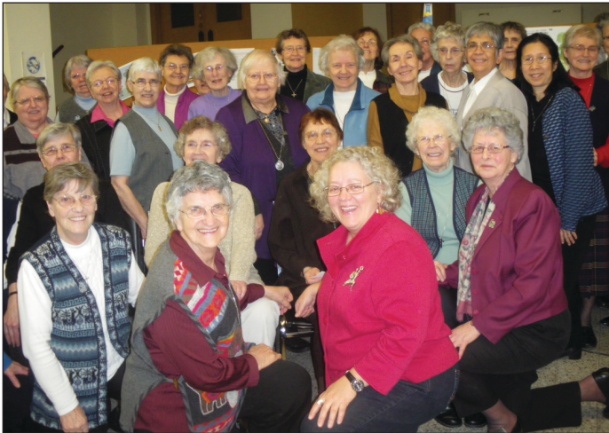
Montréal, 25 février 2012