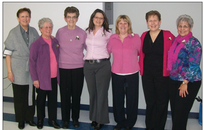
Richibouctou, 8 mars 2012