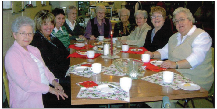
Trois-Rivières, 9 décembre 2011