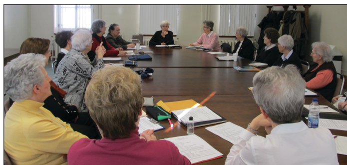
Québec, 4 février 2012