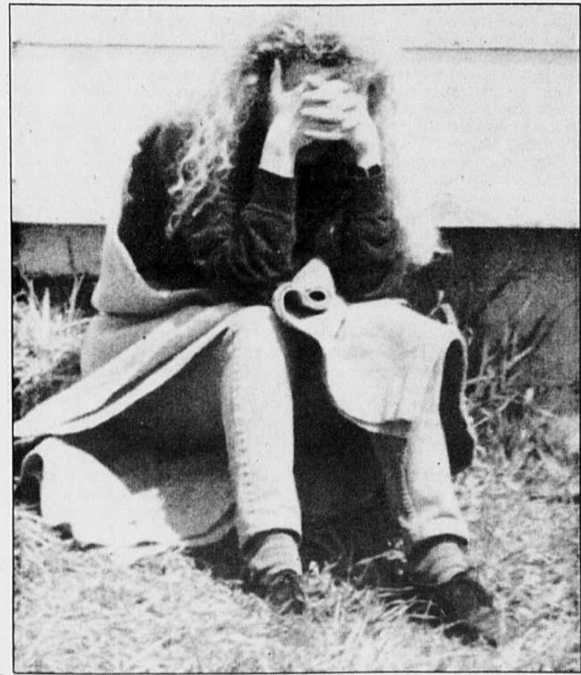
L'épouse d'un mineur encore emprisonné sous la terre contenait mal son angoisse à sa troisième journée d'attente aux portes de la mine Westray, hier.