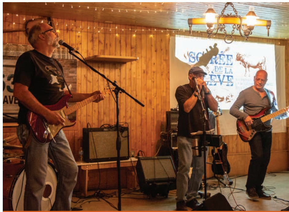
Les participants à l'évènement Soirée de la relève organisé par BMR Unicoop de Saint-Pierre au profit de la MDJ ont eu droit à une prestation musicale endiablée.

Les jeunes, c'est l'avenir; le futur, c'est eux. Les équipes de professionnels s'affairent à les outiller