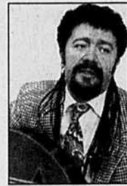
«Tombé en héros»