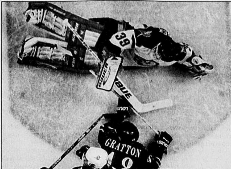
Le gardien Ron Tugnutt des Sénateurs affrontera le redoutable Dominik Hasek des Sabres, qu'on voit ici plonger pour arrêter un tir de Benoit Gratton lors du match contre les Capitals de Washington, dimanche. Les Sabres de Buffalo seront à Ottawa ce soir pour le premier match des séries éliminatoires.

Plus âgé, Martin a rappelé l'exemple des Islanders de New York,