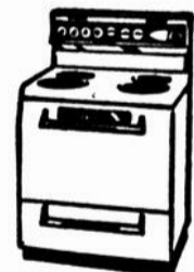
L'incomparable cuisinière Chateau V de Bélangier, 30" à 4 éléments, fenêtres "Forma-View", tubéros de commande et four éclairé, etc.