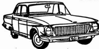
Le compact "le plus désirable au Canada", automobile Valiant 1963, de marque Chrysler, modèle V-100, 4 portes, transmission automatique, pneus à bande blanche, radio, lave-glace, etc.