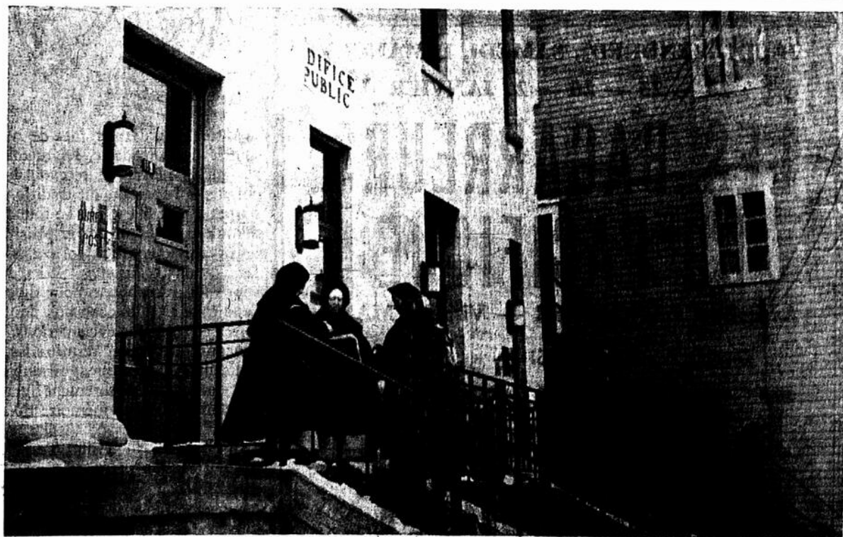
Les Soeurs Tourières sont les pourvoyeuses et les messagères infatigables des Moniales. et c'est à qui aurait un bon mot, une promesse de prières, un sourire des "petites Soeurs". La population les affectionne profondément.

Les malheureuses jeunes filles ont été transportées à l'hôpital et sont, aux dernières nouvelles, dans un état critique.