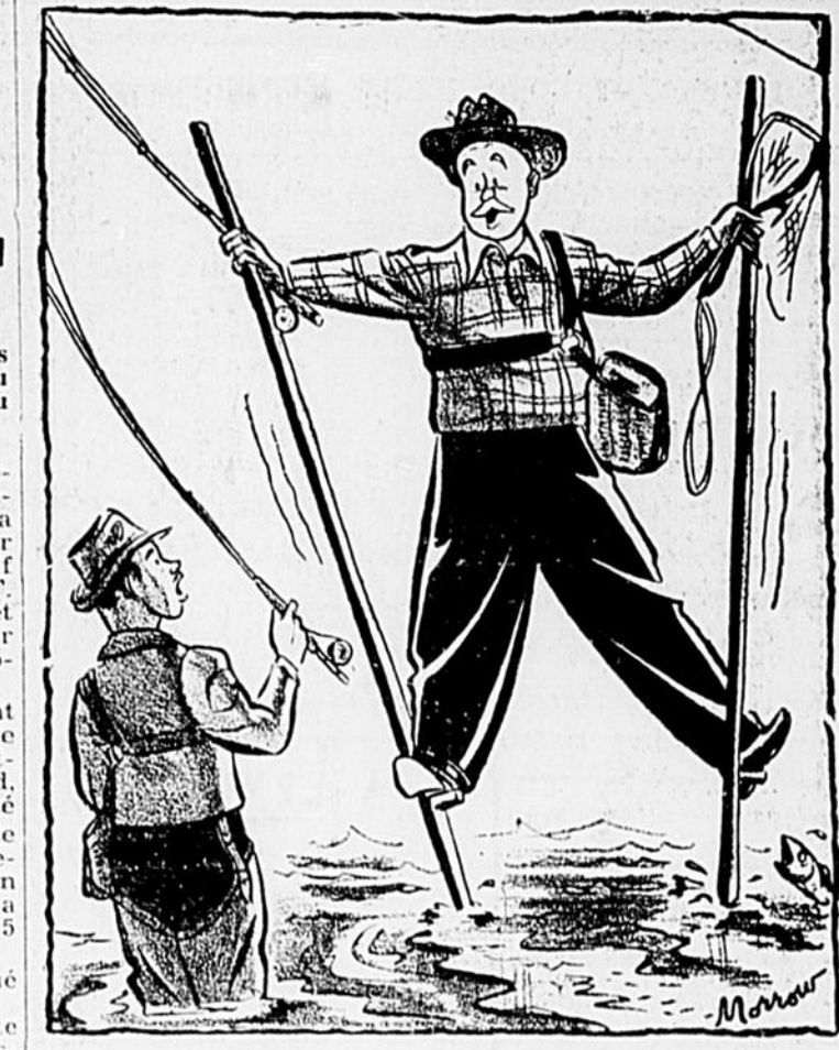
"J'ai donné mes bottes à la récupération..."

Aucun tournoi n'a été joué dans la classe "C". Toutes les rencontres de cette première ronde devront être disputées cette semaine.