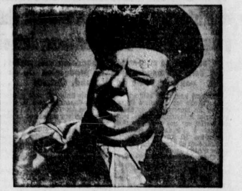
W.C. Fields, le célèbre comique de l'écran américain, en vedette dans "The Bank Dick" et "You Can't Cheat an Honest Man", qui présentera, pour la première fois à cette génération, le cinéma d'art Séville, dès jeudi.

Bien sûr, ce n'est pas une manifestation d'autonomie. "C'est par ce que nous sommes anglais que nous voulons le droit d'être Bourguignons" assure le Grand Duc. Les Britanniques sont tenaces; ils sont aussi positifs et consciencieux les savent ici rire et faire rire les autres en se montrant tels qu'ils sont.