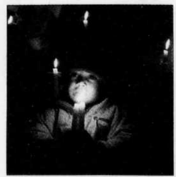
Vigile contre le bouclage de Gaza, hier, à Ramallah.