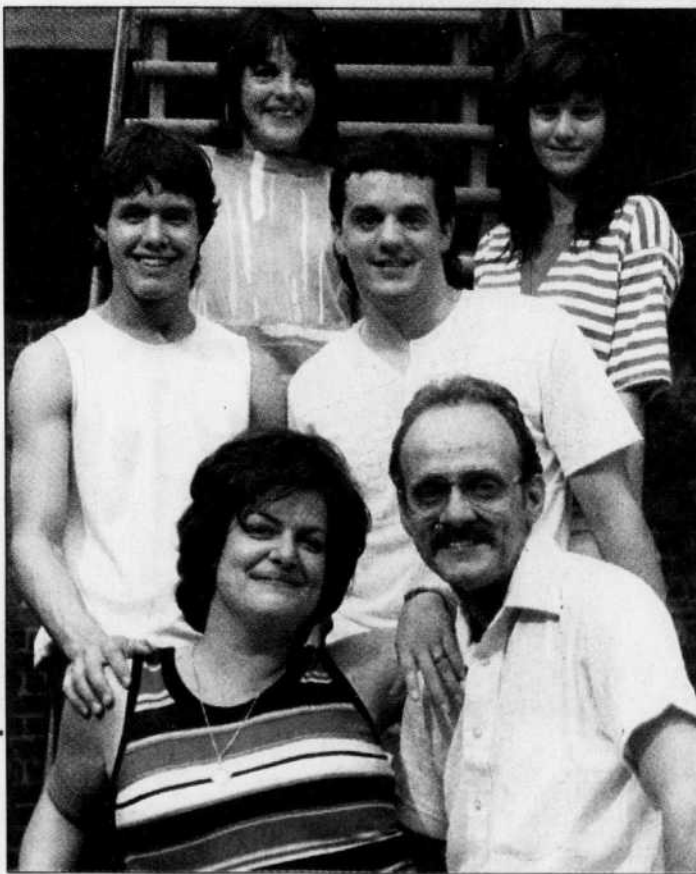
Photo de famille des Lavigueur de la minisérie de Radio-Canada.