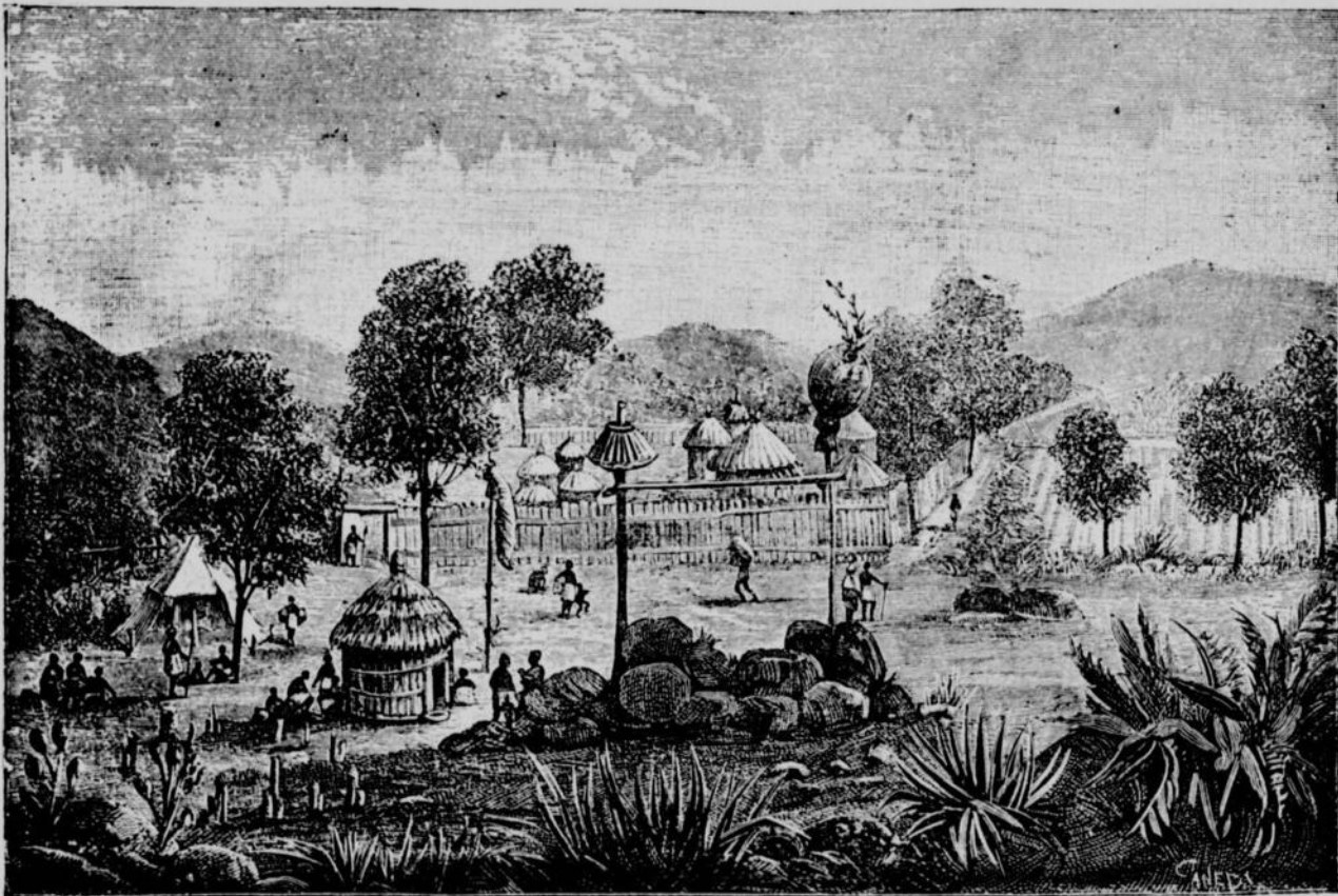
Bas-Zambèse.—Un campement en face de Mazeka, d'après un dessin du Rév. Père Courtois.

Le même jour, deux maisons de chrétiens appartenant à l'église furent démolies. On dit que l'appétit vient en mangeant ; c'est vrai surtout pour ces païens avides. Le lendemain, commençait le pillage de nos familles chrétiennes. Les trois principales et les plus riches, bien entendu, sont les