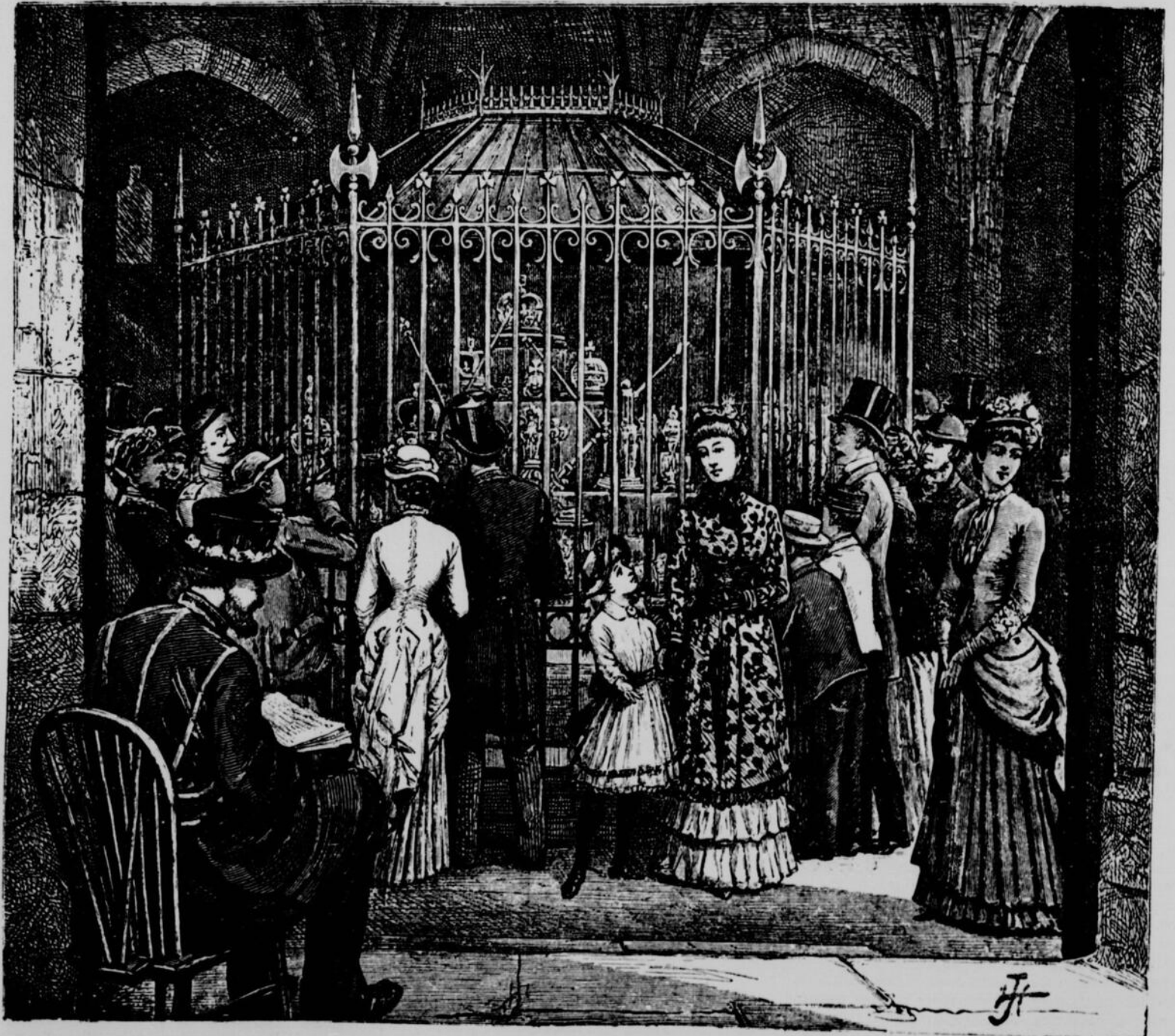
A LA TOUR DE LONDRES. — LES JOUAUX DE LA COURONNE D'ANGLETERRE