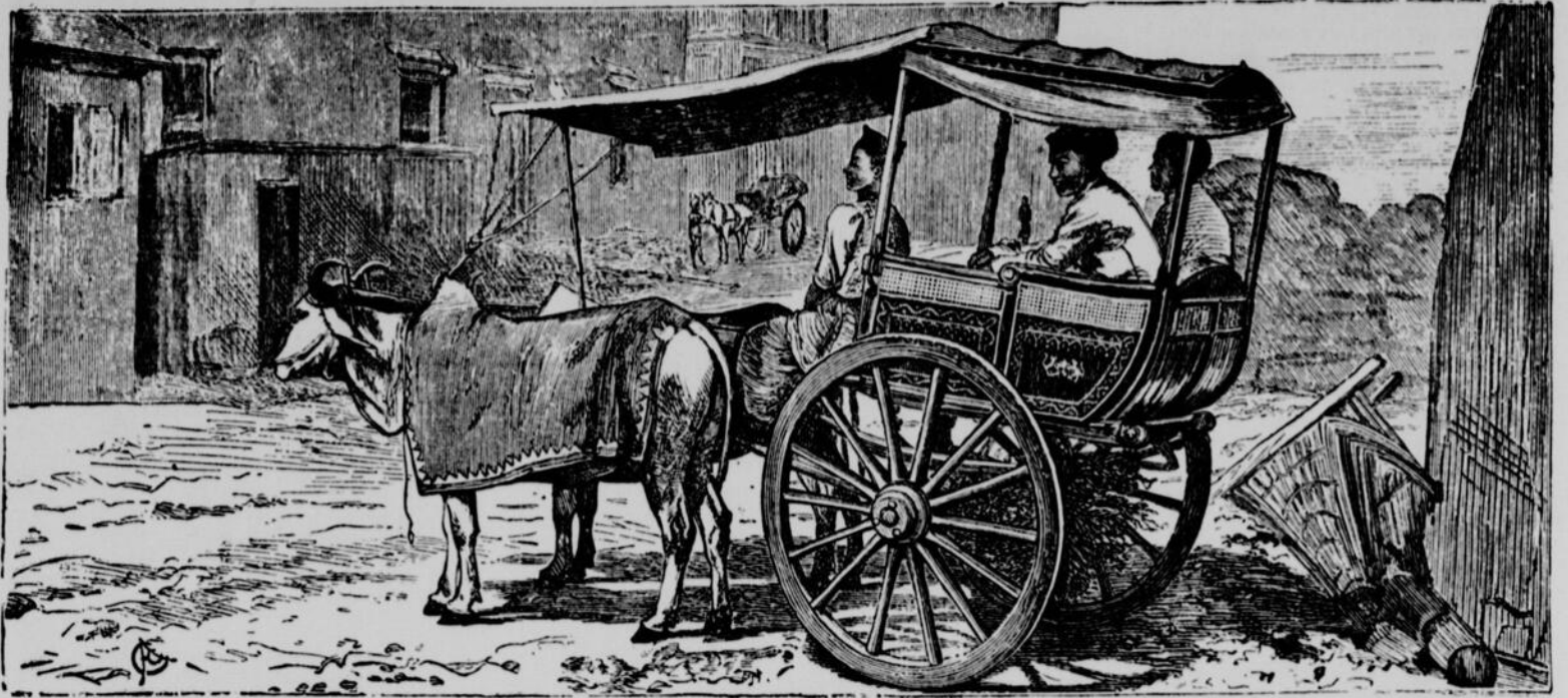
BOMBAY. — UN ATTELAGE DE ZÉBUS