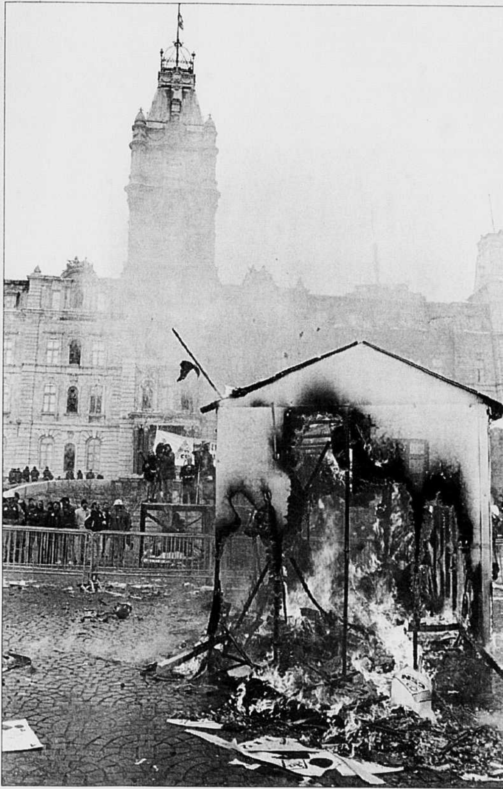
La manifestation des ouvriers de la construction contre le projet de loi 142 a laissé devant le Parlement ce symbole de la colère syndicale. Pourvu, disait un manifestant, qu'on ne voie pas ça pour vrai sur les chantiers.