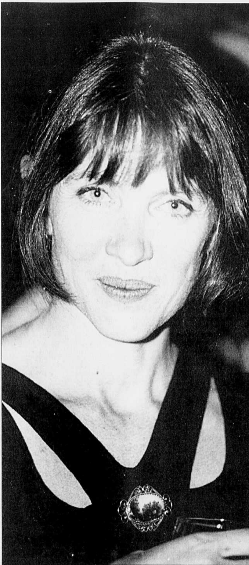
Nancy Huston, Prix du Gouverneur général 1993.

Jamais je n'ai assisté à des tractations du genre: «Tu fais passer machin, et moi j'appuie ton candidat.» Cela se fait ailleurs, très rarement chez les écrivains, respectueux qu'ils sont du travail des autres et de leur démarche artistique. Il faut souligner aussi la discrétion des fonctionnaires, tant du ministère de la Culture du Québec que du Conseil des Arts, qui ne se mêlent jamais des discussions des jurés, ne tentent pas de les influencer et respectent toujours leurs décisions. Quand il a connu la liste des finalistes du Prix du Gouver-