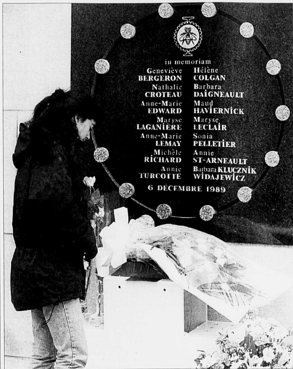
Une femme dépose une gerbe de fleurs devant la plaque commémorative de l'École Polytechnique de Montréal où 14 femmes ont été assassinées le 6 décembre 1989. Le quatrième anniversaire de la tuerie a été l'occasion de nombreuses cérémonies du souvenir hier, notamment sur les campus montréalais.

La dernière phase de l'entrée en vigueur de la loi débutera le 1er janvier 1994, lorsque des cours ou des tests seront requis pour obtenir un certificat d'acquisition d'arme à feu, le permis exigé pour pouvoir acheter une arme.