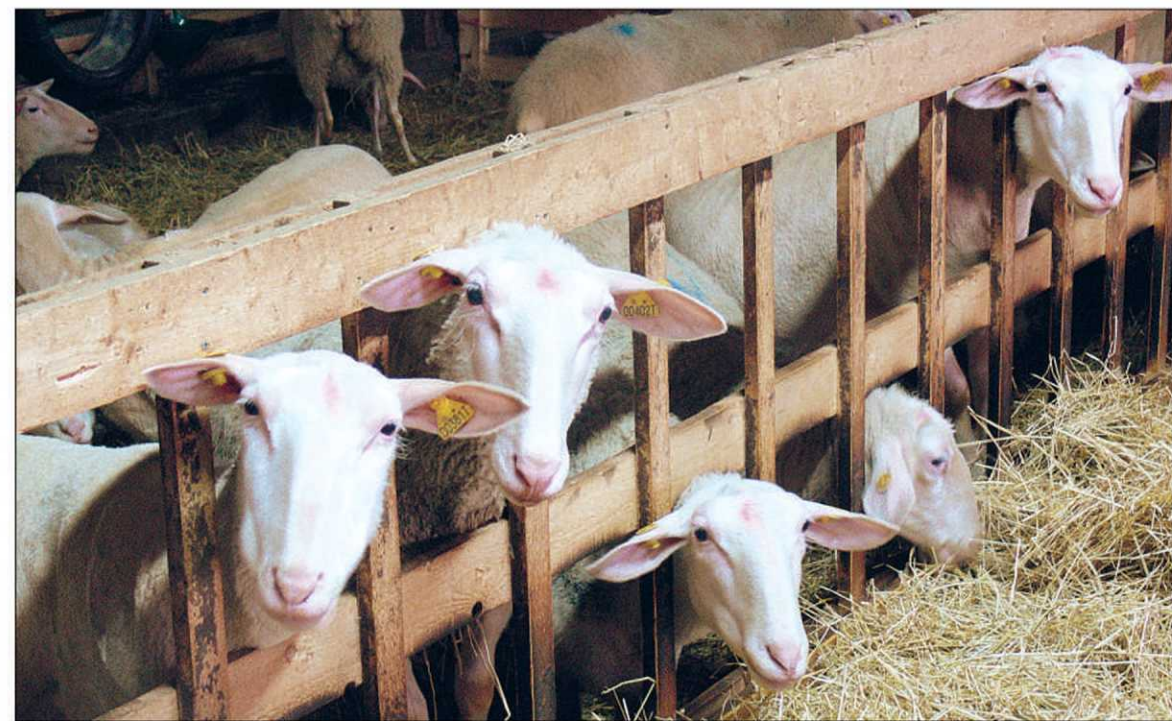
Les brebis de Maurice Dufour. L'entreprise qui se spécialise dans la fabrication de fromages fins s'est taillé au départ une réputation enviable au Québec avec son fameux Migneron.

Qu'elle passe par le fleuve ou la montagne, la Route des saveurs compte plus d'une quarantaine d'arrêts. Et que trouve-t-on le long de cette route? Des élevages de gibier, d'agneaux, d'émeus, de canards, des fromages, des bières, des charcuteries, des chocolats, des cidres, des pains, des poissons fumés... et, bien sûr, d'excellentes tables où déguster tous ces produits.