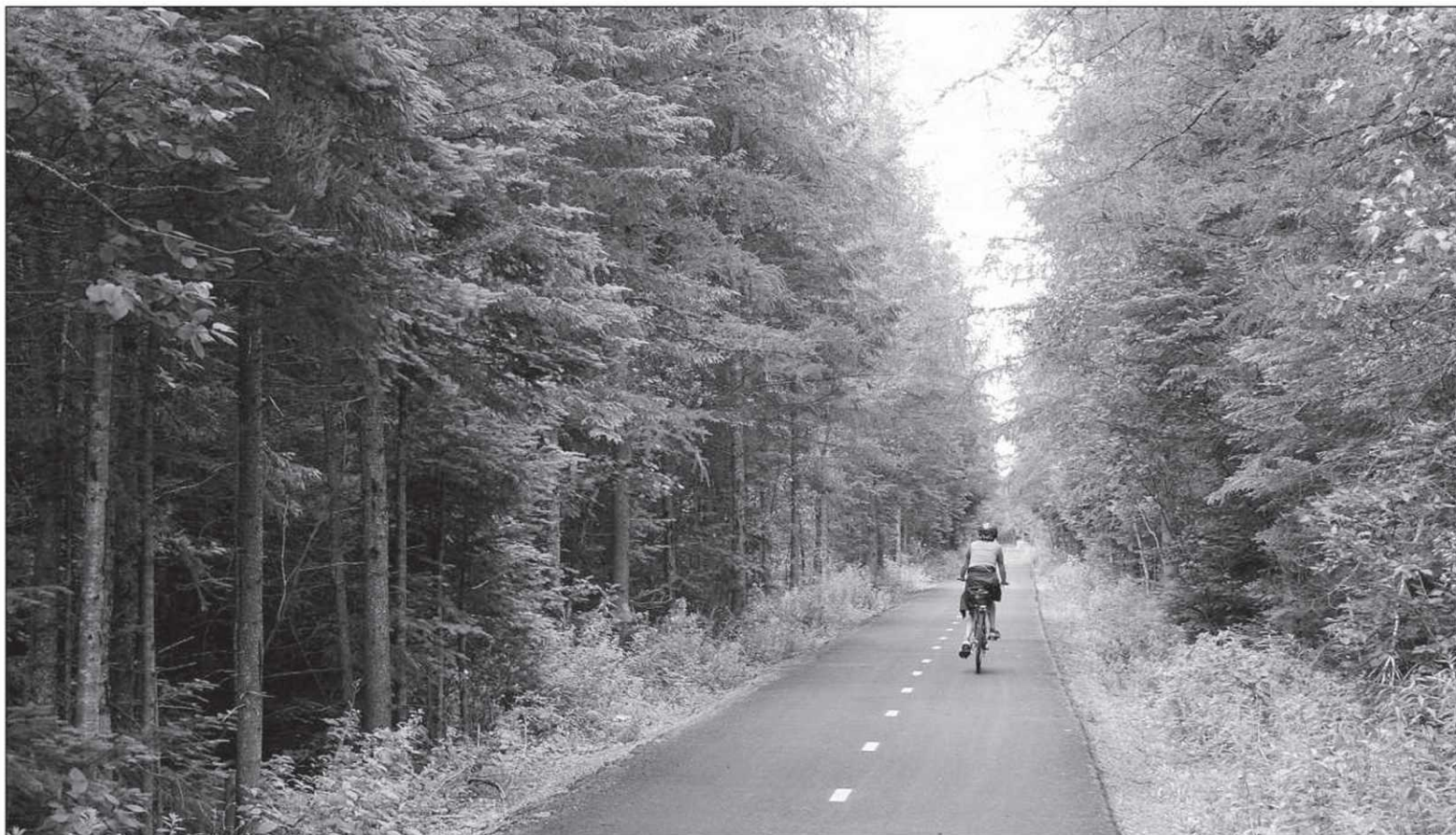
Récemment inaugurée, la cycloroute de Bellechasse a été tracée sur l'emprise ferroviaire Monk.