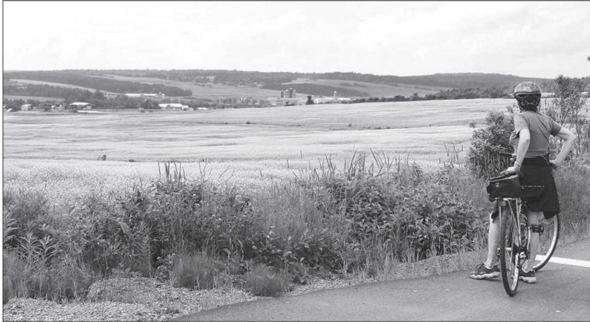
La piste cyclable croise de vastes paysages agricoles.

municipalités, soit Saint-Henri, Saint-Anselme, Sainte-Claire, Saint-Malachie, Saint-Damien et Armagh. Chacune d'elle dispose d'un stationnement d'où peuvent partir les cyclistes.