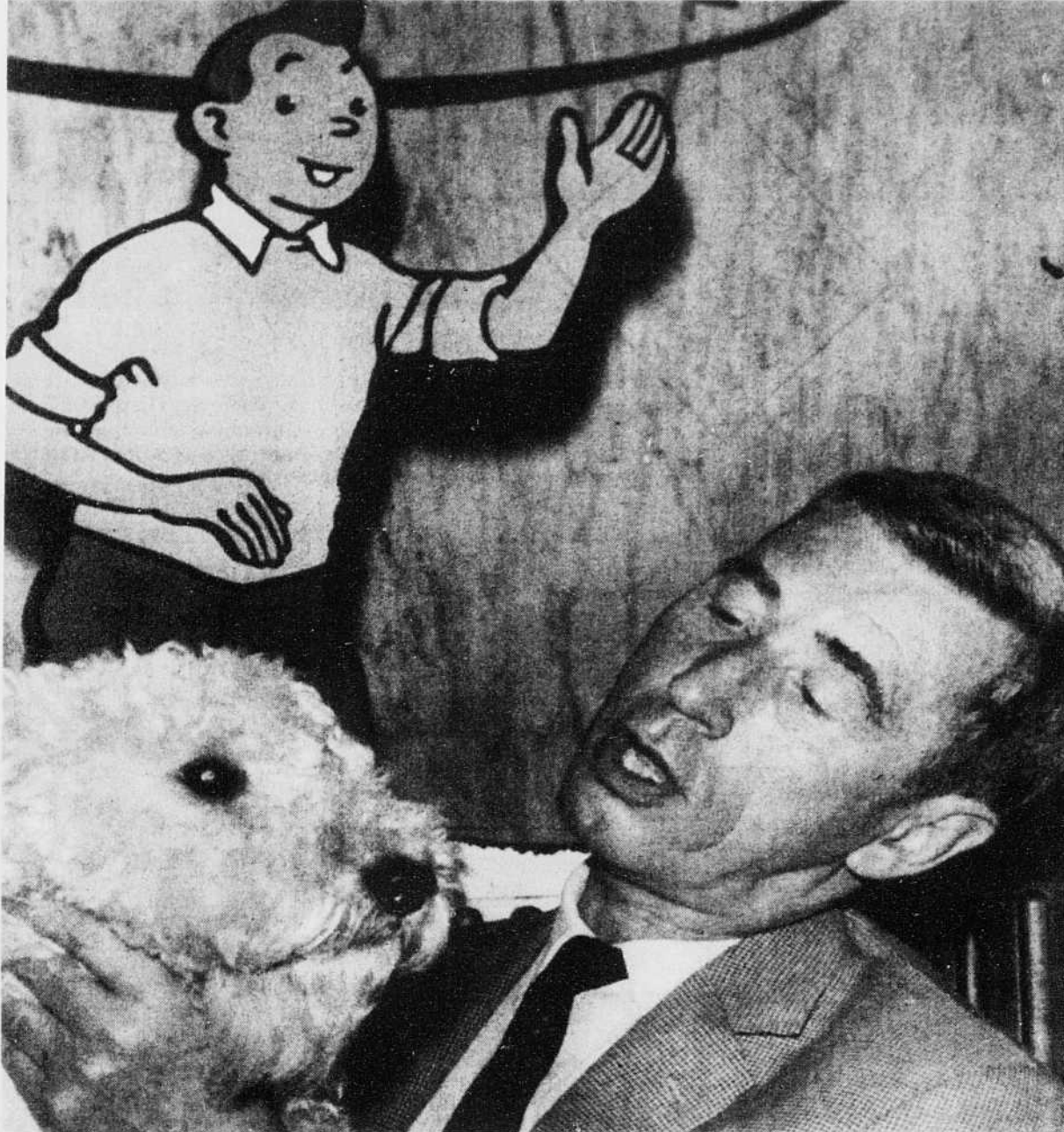
Hergé caresse un petit fox blanc, un représentant de l'espèce qui lui a inspiré Milou. Cette photo a été prise à Montréal en 1965, alors que le créateur de Tintin était venu au Salon du livre.