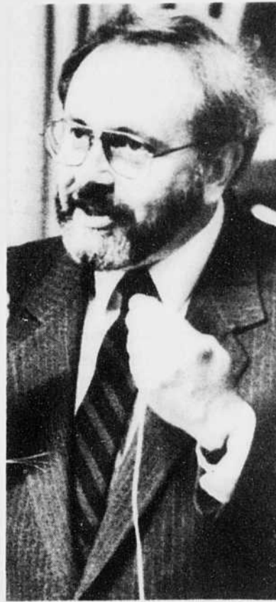
Le ministre Guy Rivard

Conseil de la langue française de mettre en place des "indicateurs" pour être en mesure de se demander dans trois ou cinq ans si on a fait des progrès dans tel ou tel chapitre de la langue française.