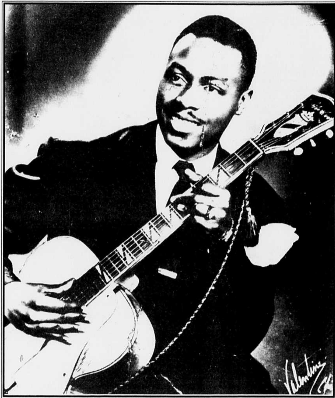
S'il y a un musicien de blues qui a été abondamment pillé par les maqueureaux de l'histoire, c'est bel et bien Jimmy Rogers.

Le père du Chicago blues est à Montréal!