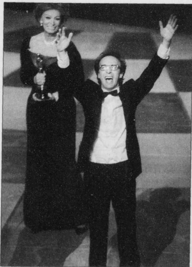
Benigni n'a pas fait exception à la règle, aux Oscars.

Adulé par la critique italienne qui n'a pas hésité à le comparer à Charlie Chaplin, Benigni qui se définit lui-même comme «un clown» et aime se faire passer pour un «naïf», est