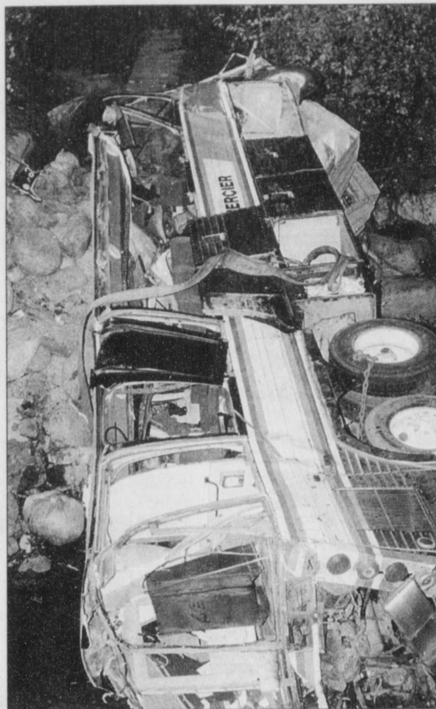
L'accident des Éboulements a fait 44 victimes.

En conclusion, le coroner n'appuie aucunement la demande de crédits additionnels formulée par la SAAQ.