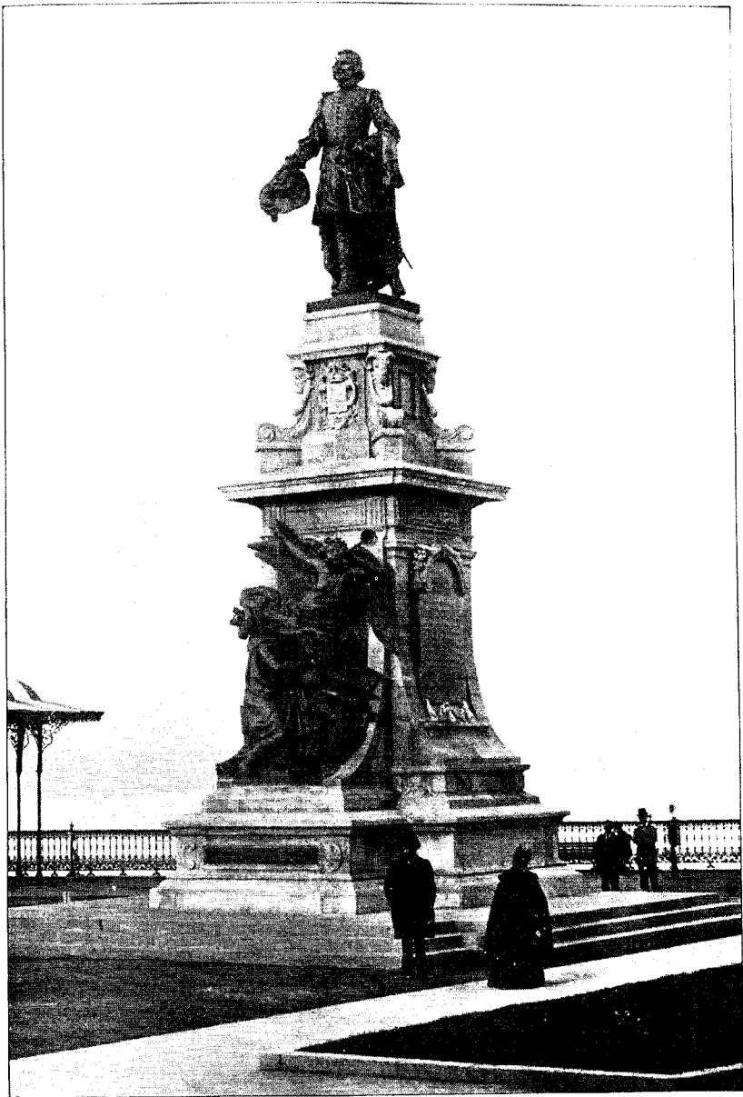
MONUMENT CHAMPLAIN INAUGURÉ À QUÉBEC LE 21 SEPTEMBRE 1894