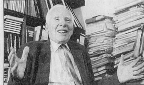
Joseph Rotblat, Prix Nobel de la paix 1995: un camouflet à la France et la Chine.