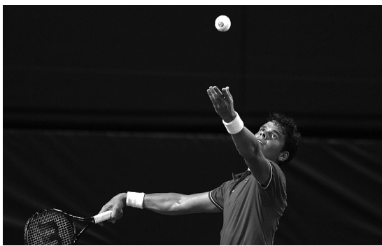
Milos Raonic, classé 23 e au monde, fera face au Suisse Roger Federer aujourd'hui à Madrid.

Ce premier match sur la terre battue bleue ne passera toutefois pas à l'histoire. Djokovic a