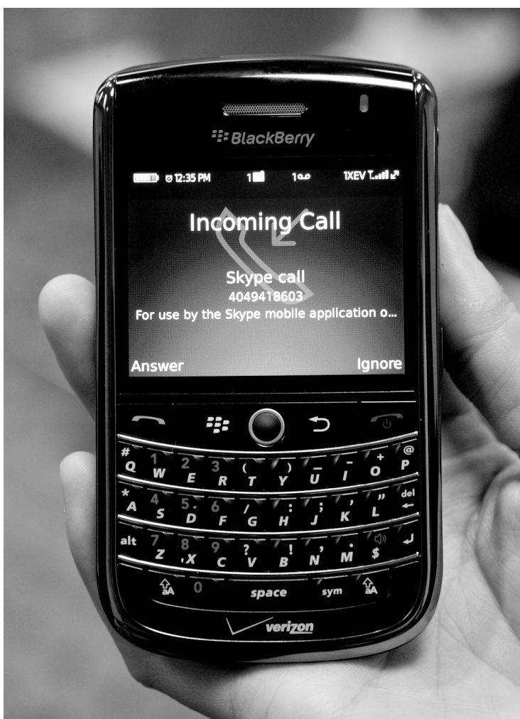
Les dirigeants embauchés apportent avec eux une expertise dans le domaine du sans-fil.