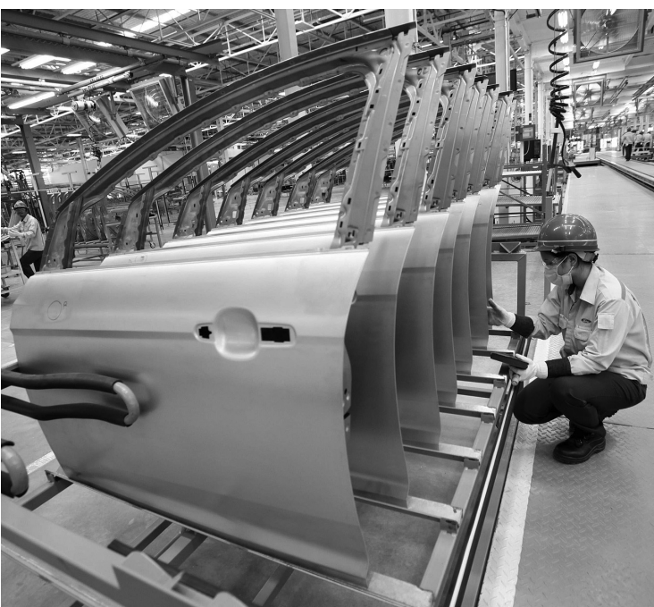
La mesure permettra à Ford de construire 40 000 véhicules de plus cette année.