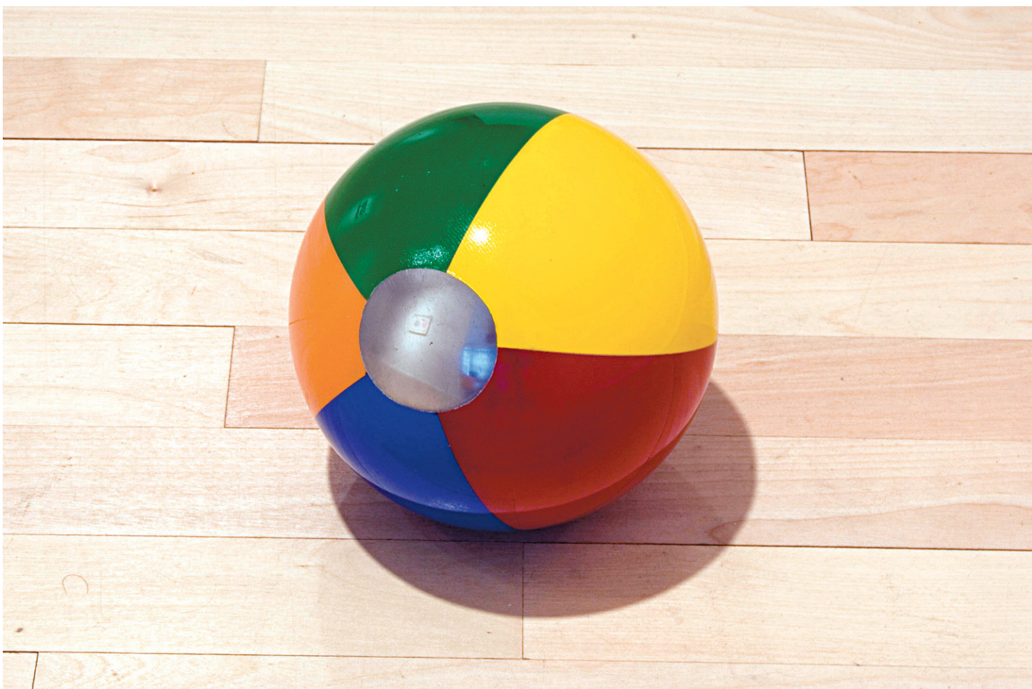
TJANA STERBAK ET GALERIE LAROCHE/JONCAS

Condensed , de Jana Sterbak (1979 – 1996, fer, plomb et peinture, 15 cm de diamètre, 22 kg)