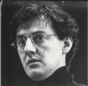
René Richard Cyr