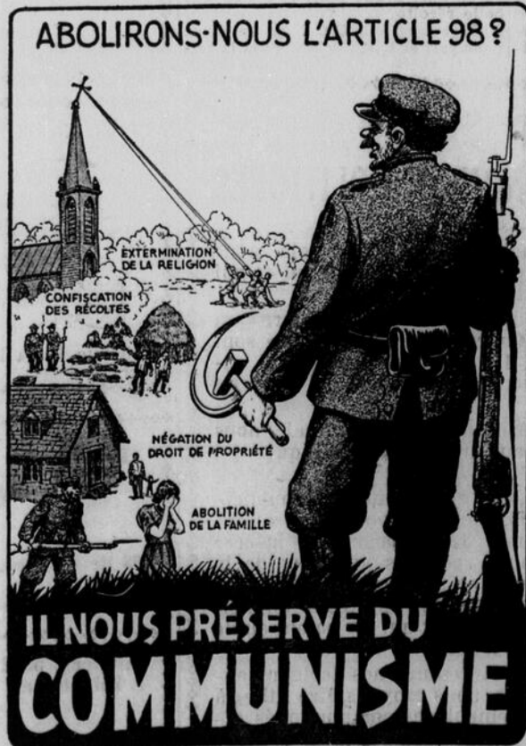
Publié par l'Organisation Centrale Conservatrice.

Si cela arrivait, les communistes auraient le droit de poursuivre leurs activités au même titre qu'une religion reconnue ou une société nationale; ils auraient le droit de prêcher la prise du pouvoir par la violence et la révolte armée. Ils pourraient librement et LÉGALEMENT poursuivre leur œuvre d'athéisme, de révolution, de destruction de la tradition et du christianisme. Ils pourraient librement et LÉGALEMENT salir l'âme nationale, souiller l'esprit de vos enfants, afin d'amener un régime qui, comme en Russie Soviétique: