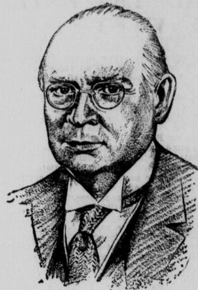
Le Très Hon. R. B. BENNETT, Premier Ministre du Canada

L'article 98 du Code Criminel déclare illégales les activités communistes au Canada. Cet article est notre seule protection, notre seul rempart contre le plus grand danger social de tous les temps.