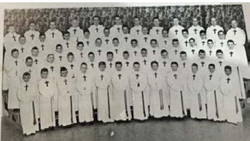
Pochette RCA Victor d'un long-jeu des Petits Chanteurs de Granby