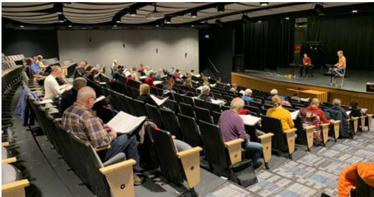
Le Choeur polyphonique de Lévis en répétition.