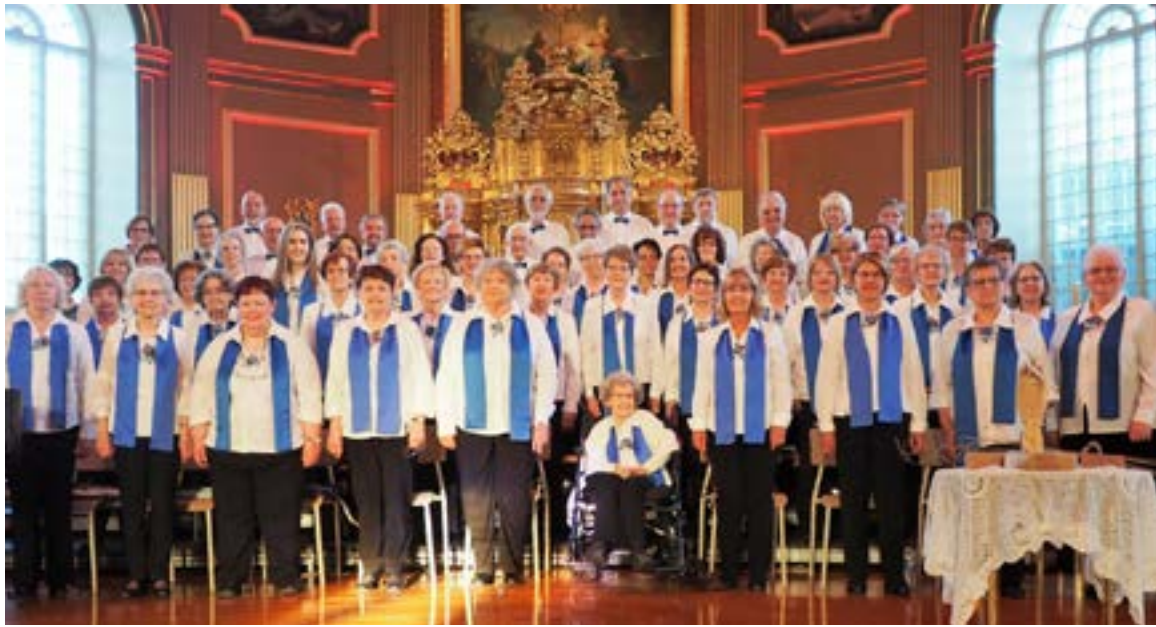
Chorale Les Myosotis, concert de mai 2019

Comme choriste, je dois éviter de chanter trop fort, je dois plutôt m'assurer de faire en sorte que ma voix fasse partie du chœur. La chorale prend la forme d'une communauté à part entière.