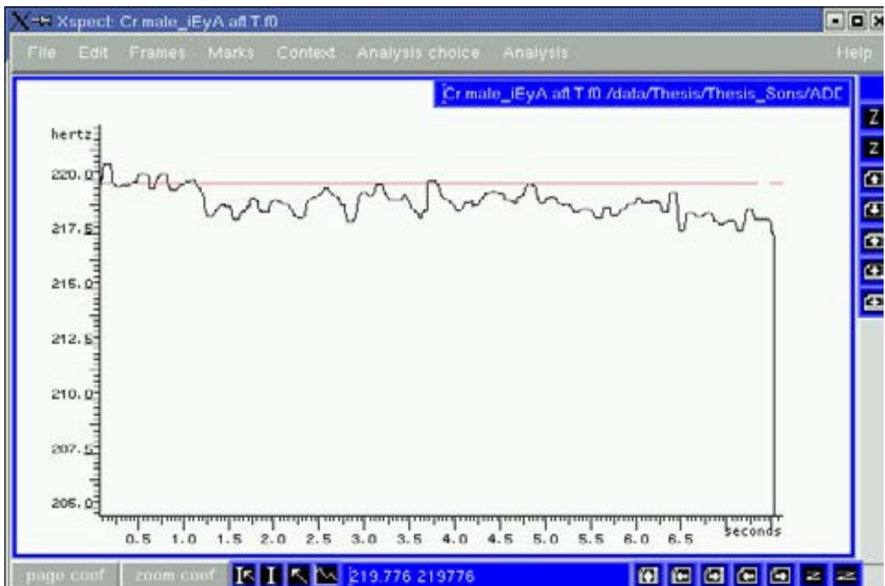
Figure 2. Chœur d’hommes qui chante la série de voyelles [i - e - y - a] après avoir travaillé le principe de chiaroscuro.