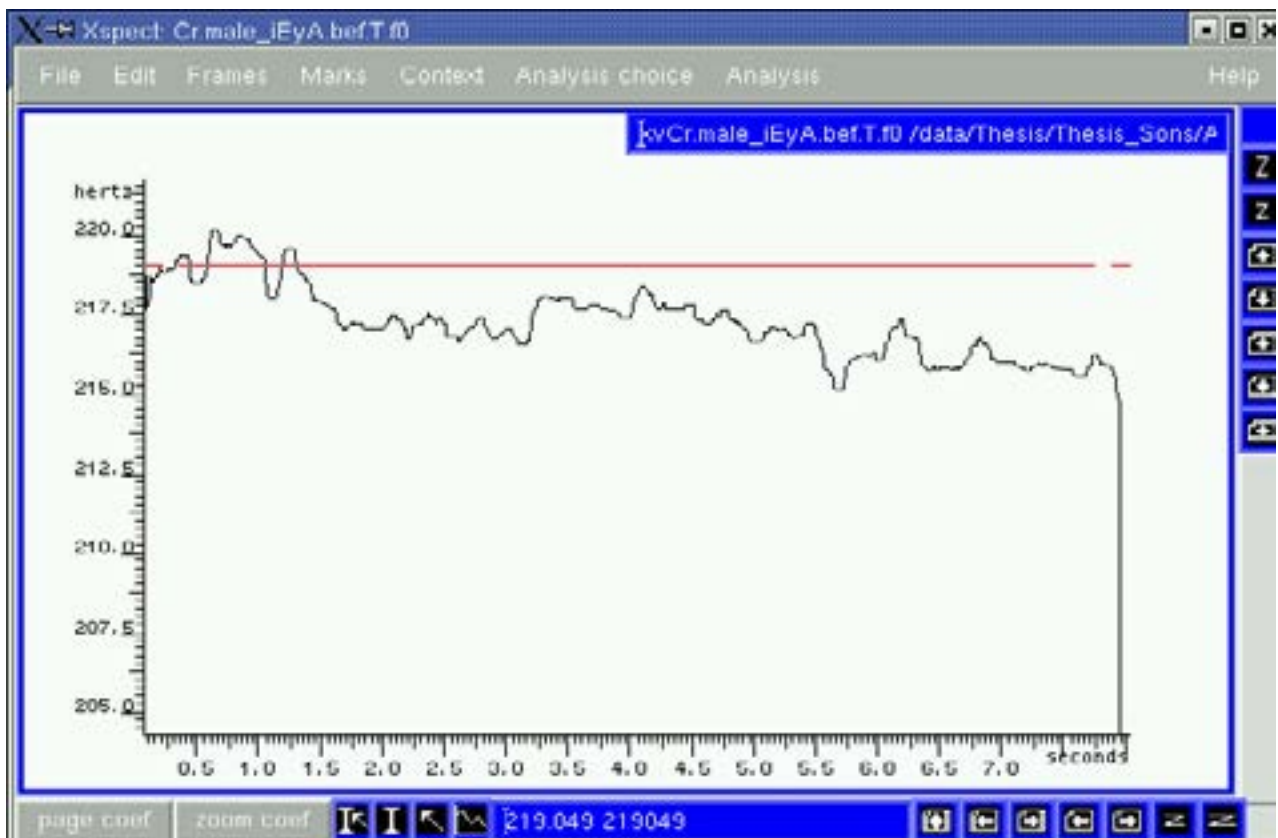
Figure 1. Chœur d’hommes qui chante la série de voyelles [i - e - y - a] avant d’avoir travaillé le principe de chiaroscuro.