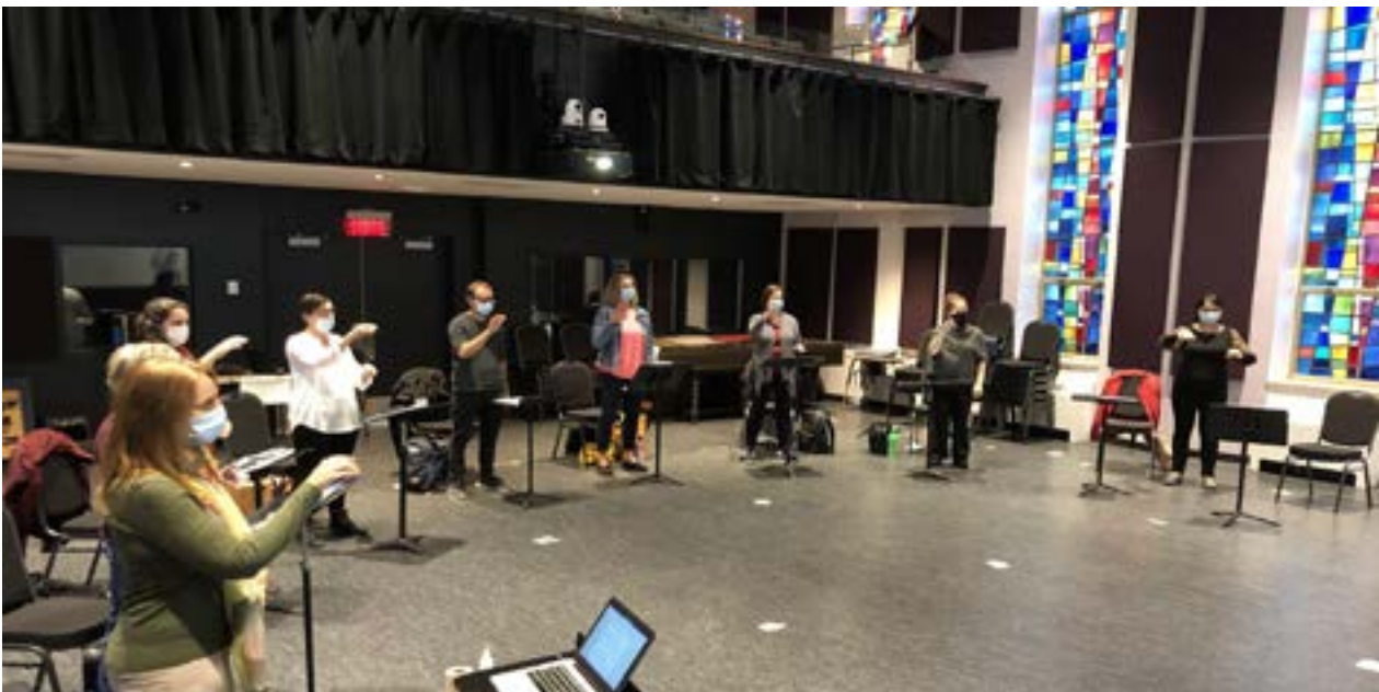
Les participants à la formation à Montréal découvrent la gestique.

Plusieurs formations de direction chorale en milieu scolaire sont prévues à l'hiver 2022. La prochaine se donnera les jeudi 13 et vendredi 14 janvier 2022, à la Coopérative des professeurs de musique à Montréal. Les inscriptions sont ouvertes!