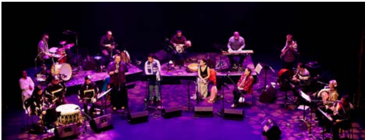
Oktoecho, pendant le concert Transcestral au Théâtre Outremont, le 27 novembre 2021.