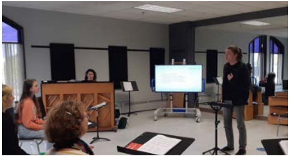
Les participants à la formation à Jonquière mettent en pratique leurs apprentissages.

Ces formations ont remporté un franc succès auprès des participants, dotés de profils très diversifiés. En effet, le seul prérequis pour participer est de savoir