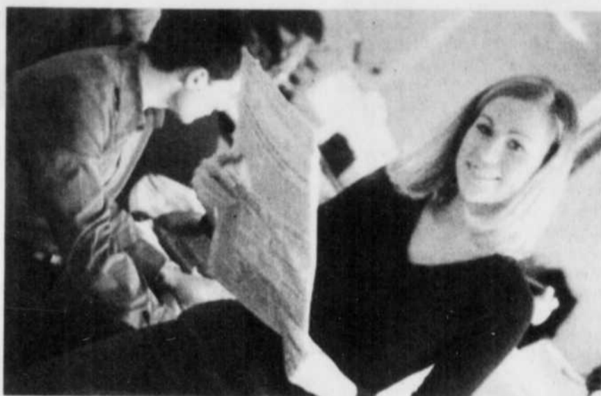
En consultant les quotidiens, on peut connaître les formations offertes sous forme d'achats de groupes.

Tiré de : Guide de la formation continue, édition 2002-2003, Sainte-Foy, Septembre éditeur.