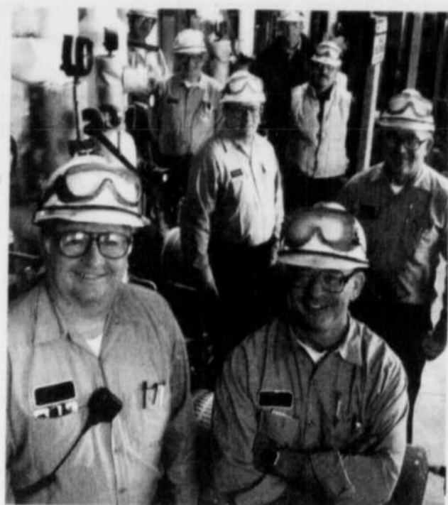
La reconnaissance des acquis permet aux travailleurs d'obtenir des crédits pour l'expérience acquise sur le terrain.

La réussite de cette jeune femme relève d'un projet pilote mené par la CSDM. D'autres projets de même nature ont été menés en 2002-2003 dans toute la province, question de vérifier la possibilité d'étendre un système de reconnaissance des acquis. Dans d'autres commissions scolaires, on a travaillé à mettre en place des outils pour mesurer les expériences des candidats dans les milieux communautaire et politique, leurs activités personnelles et économiques ou leur engagement dans l'univers culturel et récréatif.