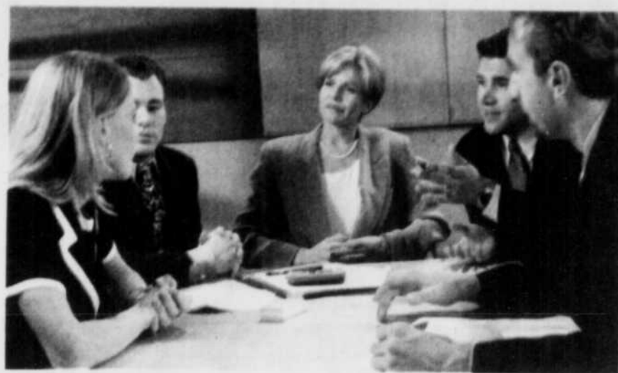
Les employés qui obtiennent une attestation d'études collégiales sont plus qualifiés et plus motivés.

S'inspirant d'une expérience tentée dans une caisse des environs, elle négocie avec son patron et le Collège Édouard-Montpetit la possibilité de suivre la formation en alternance au cégep et à la caisse même. Elle convainc en outre l'employeur de s'adapter à la réalité d'une grande part du personnel — la monoparentalité — en lui confiant les clés de l'établissement un samedi sur deux. « Nous pouvons ainsi suivre nos cours un jour où nous n'avons pas nos enfants ». À noter : tous peuvent aussi s'inscrire aux cours enseignés dans les caisses avoisinantes qui ont suivi le pas. « Cette formation est importante pour