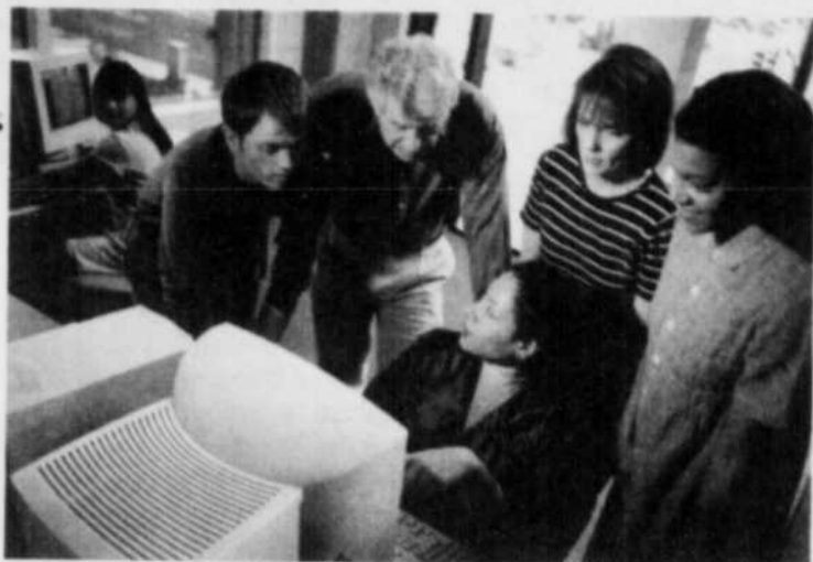
En 2000, 17 % de la formation en entreprise diffusée au Canada était à l'aide de l'apprentissage virtuel.

L'autoapprentissage asynchrone équivaut à un apprentissage solo, sans l'aide directe d'un formateur. Il s'agit ici d'une véritable expérience d'autoformation qui minimise l'aspect de la supervision. L'élève a comme principal outil des cédéroms d'autoformation avec des liens Internet qui lui donnent accès à des sites spécialisés où il peut puiser des informations complémentaires à celles inscrites