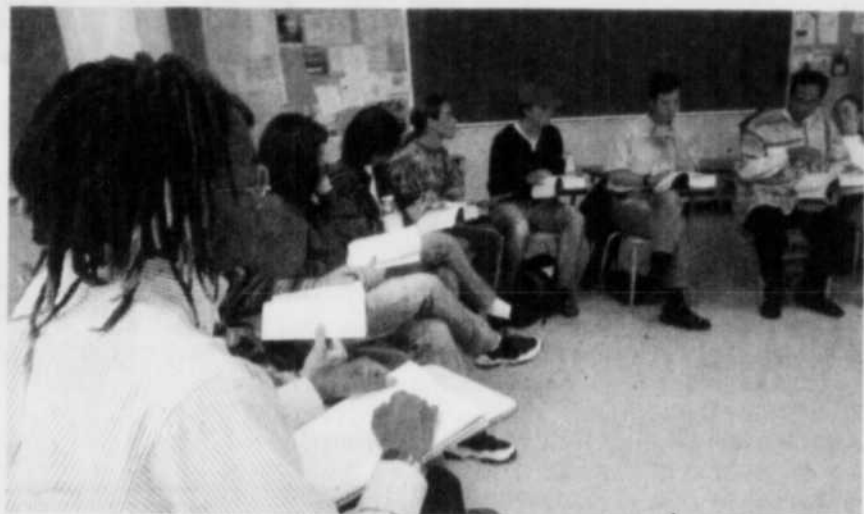
D'après Statistique Canada, le bilinguisme est passé de 16 % à 23 % en seulement dix ans chez les 15 à 25 ans.

Les entreprises peuvent bénéficier d'une formation sur mesure pour leur personnel, selon les connaissances existantes des employés et les objectifs poursuivis. Il peut s'agir de cours de grammaire, de compréhension écrite ou encore d'ateliers de conversation ou de jeux de rôles simulant des conversations d'affaires.