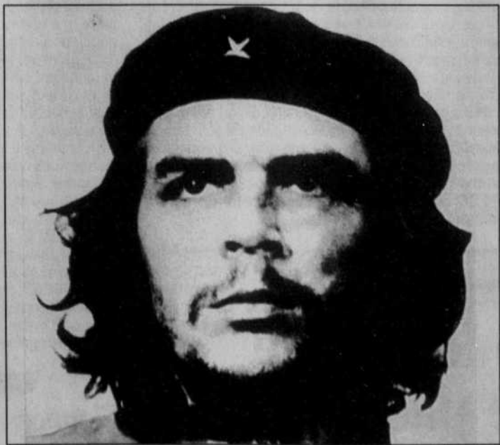
Ernesto «Che» Guevara

Il ne croit pas que Fidel Castro ait voulu, comme on l'a dit, se débarrasser de Guevara en ne lui assurant pas le soutien du PC bolivien sur place. La réalité est plus simple: «Pour les Soviétiques, Che était un petit-bourgeois aventuriste, et les communistes boliviens avaient la même position. Il n'a pas été reçu avec enthousiasme par les Boliviens, très nationalistes, qui n'admettaient pas qu'un étranger vienne faire la révolution chez eux, un Argentin de surcroît. La responsabilité est celle du Che, qui a insisté pour aller sur ce front, comme il avait voulu aller au Congo. Pour moi, Guevara était l'archétype du guerillero, un théoricien d'une exceptionnelle valeur au combat. Mais là, la méconnaissance du terrain était époustouflante. En Bolivie, la réforme agraire avait été faite, chaque paysan était propriétaire de sa terre, et le communisme c'était le diable. La population était viscéralement anticommuniste. Comment le Che a-t-il pu se tromper à ce point? Erreur énorme ou suicide. Son époque en Bolivie est une fuite en avant, il n'a jamais été aidé par les paysans