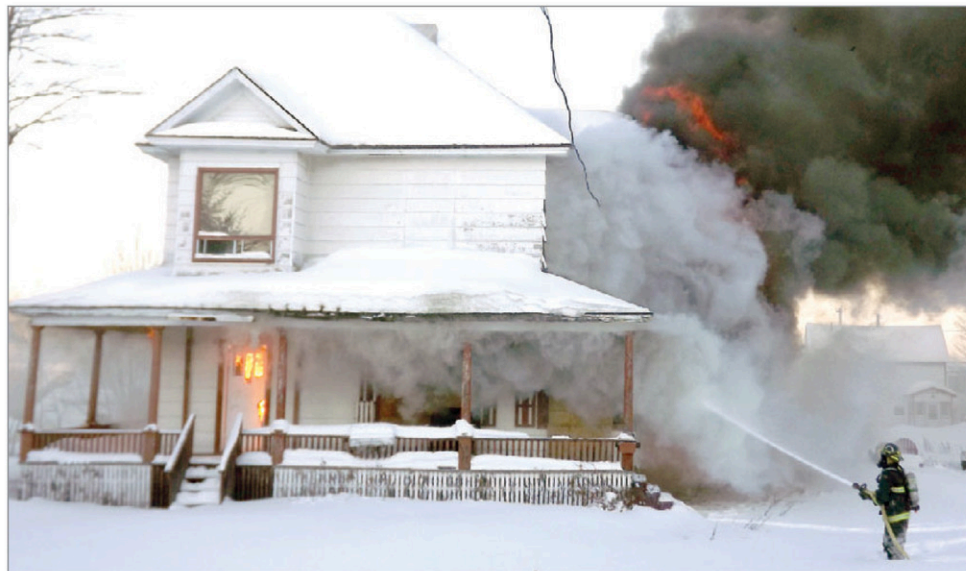
Les pompiers ont combattu l'incendie pendant plusieurs heures.

pour accompagner les touristes. Des magasins de vente d'articles ornithologiques, comme des jumelles, des recueils ou des vêtements auraient aussi éventuellement leur place. Il y a un potentiel de développement économique certain qui entoure le développement de cet attrait touristique », conclut Monica Demoss.