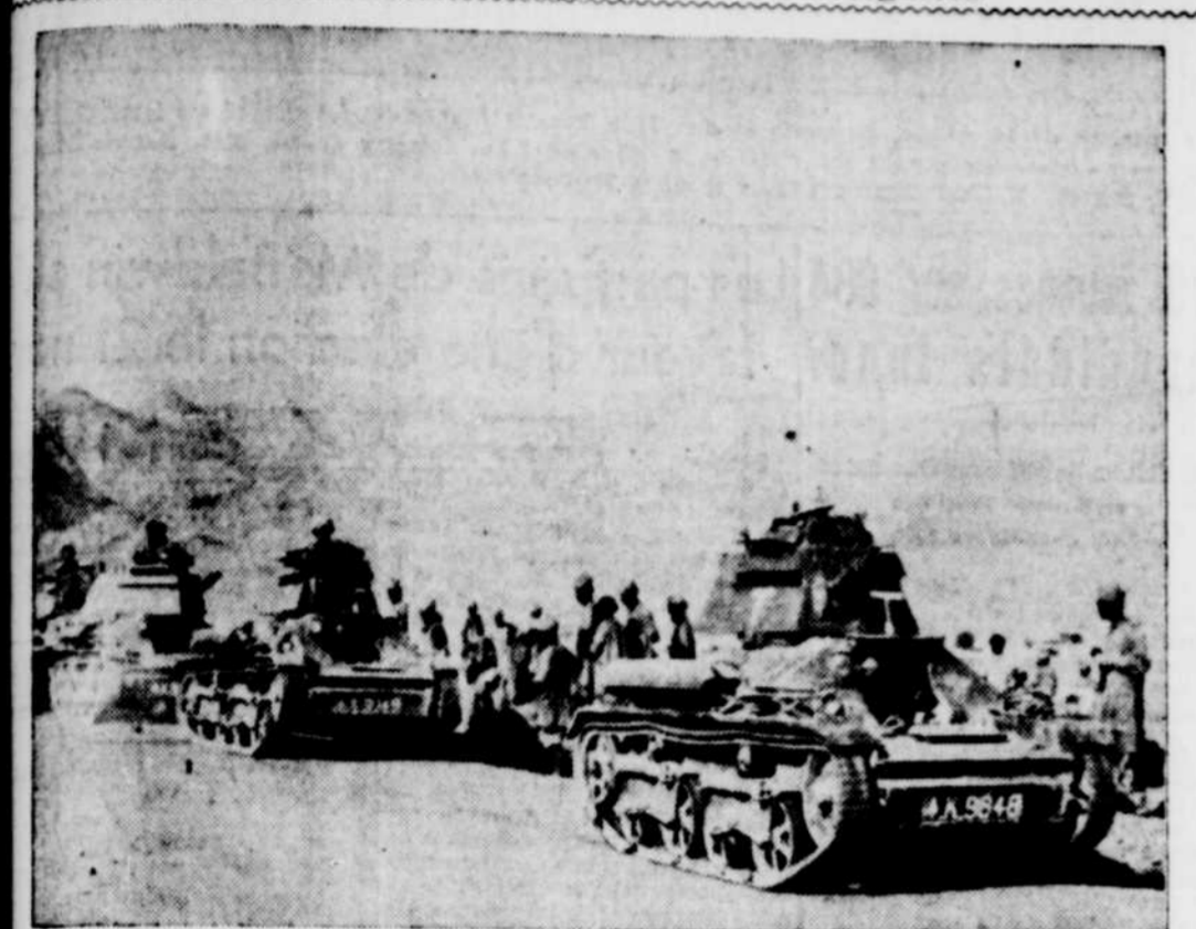
Pendant que les Italiens et les Ethiopiens occupent la première page des journaux les troupes anglaises ont fait la guerre et triomphé de tribus hostiles et elles se sont emparées de la passe de Nahakki. L'armée de l'Inde fut la seule à poursuivre toute la campagne et ici on voit une partie faisant une reconnaissance dans la Vallée de Toratiga. Ces chars d'acier furent utilisés avec le plus grand succès.

Une victoire britannique sur les indigènes