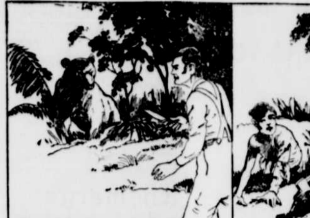
Pour son jeune maître Pierre Gagnon pouvait donner sa vie. Un jour à la fin d'août, Jean Rivard laisse ses compagnons pour aller examiner un champ de sarrasin, lorsqu'il vit un animal à poil noir, au museau fin, aux oreilles courtes; un ours. Que faire, armé seulement d'un couteau?