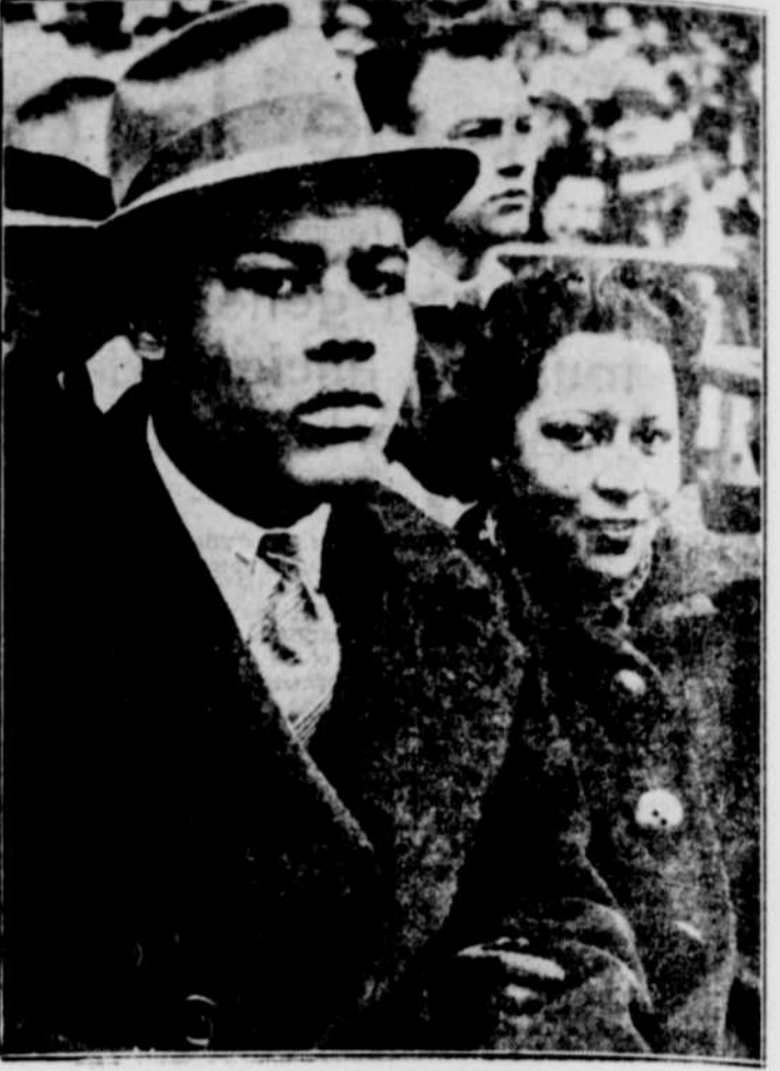
Voici une photo de M. et Mme Joe Louis, prise au cours d'une des parties de la série mondiale à Détroit, la semaine dernière.