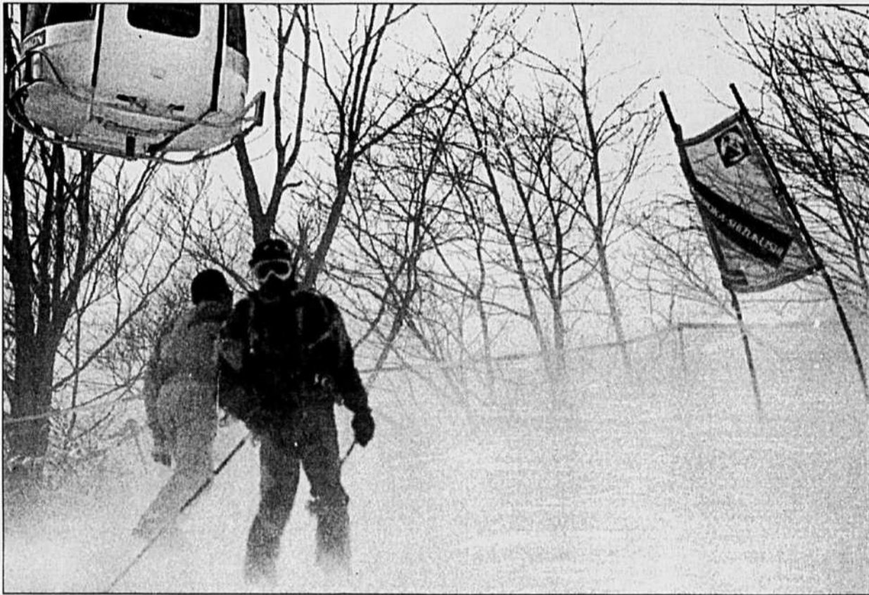
Critiqué pour le profil peu accentué de ses pistes, le site de Morioka commence à l'être en raison de ses conditions climatiques difficiles.