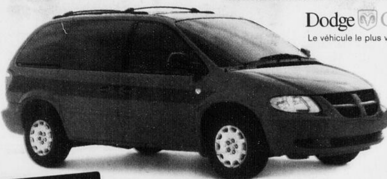
Dodge Caravan 2002

Dodge Caravan Le véhicule le plus vendu au pays.