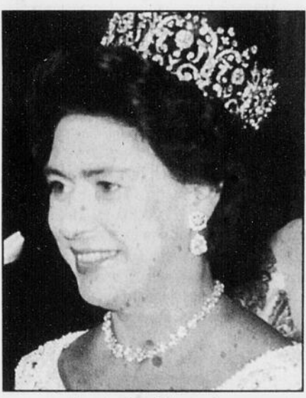
La princesse Margaret

Le public est aussi invité à laisser des messages sur le site Internet de la famille royale en mémoire d'une personnalité qui, selon les mots de son neveu le prince Charles, «aimait la vie et