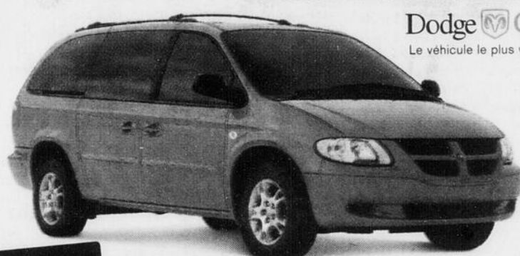
Dodge Grand Caravan 2002

Dodge Caravan Le véhicule le plus vendu au pays.