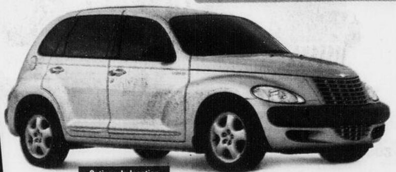
Chrysler PT Cruiser 2002

Ou procurez-vous ce PT Cruiser 2002 à un prix encore jamais vu.