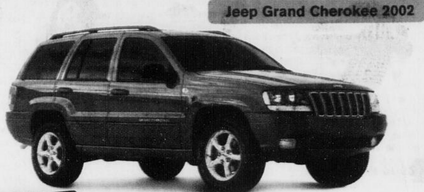
Jeep Grand Cherokee 2002

Profitez d'offres exclusives comme 0% de financement à l'achat jusqu'à 48 mois sur les éditions olympiques limitées des Dodge Caravan et Grand Caravan et du Jeep MD Grand Cherokee.