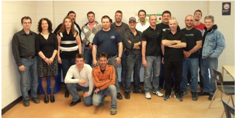
Une partie du groupe des diplômés du programme Gestion d'une entreprise de construction.

« Dans une industrie qui fait face à de grands changements, les attentes du public et de la clientèle face à la compétence des entrepreneurs sont élevées. Cette formation a permis à de futurs entrepreneurs de s'y préparer adéquatement. Tous et toutes ont démontré une persévérance soutenue