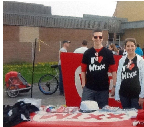
L'escouade WIXX-NRJ de COSMOSS Rimouski-Neigette était sur place lors de l'inauguration de la piste cyclable de la municipalité de Saint-Fabien pour faire la promotion de l'activité physique parmi les élèves de l'école de l'Écho-des-Montagnes.

à encourager les membres de leur famille à les accompagner.