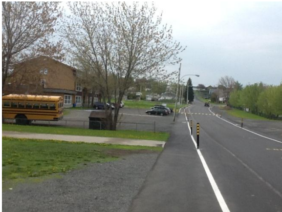
La piste cyclable inaugurée dans la municipalité de Saint-Fabien doit rendre le transport actif plus sécuritaire et encourager son utilisation tant chez les élèves de l'école de l'Écho-des-Montagnes que dans la population.

L'école de l'Écho-des-Montagnes et ses partenaires, la municipalité de Saint-Fabien, le Club optimiste de Saint-Fabien et le Centre de santé et de services sociaux de Rimouski-Neigette, ont inauguré le 30 mai la première phase de la piste cyclable et piétonnière qui permet dorénavant aux élèves et à la collectivité de circuler de manière active en toute sécurité dans les rues de Saint-Fabien.