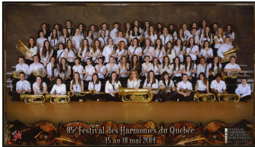
Les élèves de l'harmonie junior de l'école du Mistral (première et deuxième secondaire) lors du Festival des harmonies et orchestres symphoniques du Québec, à Sherbrooke, en mai dernier.

Soulignons les excellents résultats qu'ont obtenus les harmonies et les stages bands de l'école du Mistral lors du dernier Festival des harmonies et orchestres symphoniques du Québec de Sherbrooke, les 15, 16 et 17 mai dernier. L'harmonie avancée du Mistral, qui compte des élèves de quatrième et de cinquième secondaire, a notamment récolté la note d'or avec un résultat de 88 % dans la catégorie junior concentration 20 ans et moins. Ce résultat la classe en troisième position au Québec et lui vaut une bourse de 50 $.