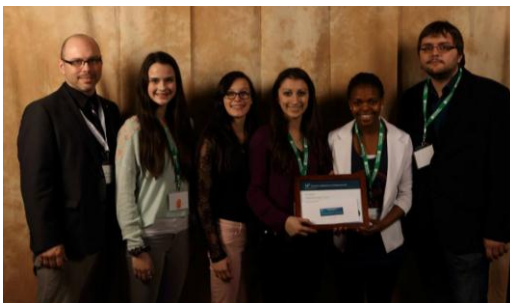
L'équipe de la Jeune coop du Mistral