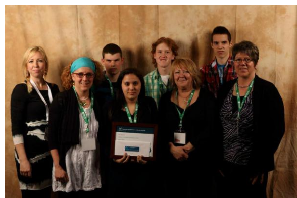
L'équipe de Délices et festins

Au niveau secondaire adaptation scolaire, les élèves à l'œuvre chez