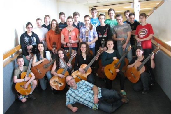
L'ensemble de guitares Impact

Par ailleurs, la prestation des élèves de l'ensemble Impact a été particulièrement remarquée par les juges. On leur a demandé de se produire lors du concert de clôture, le dimanche après-midi.