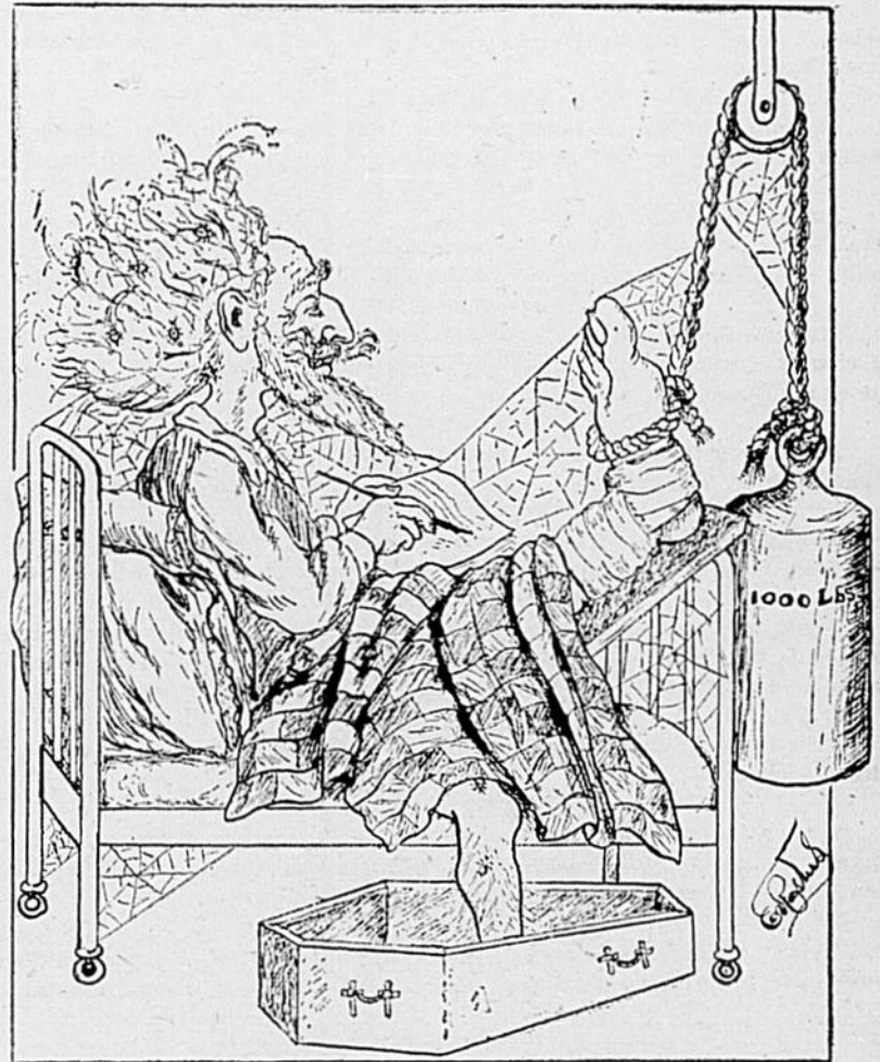
PORTRAIT DE L'AUTEUR