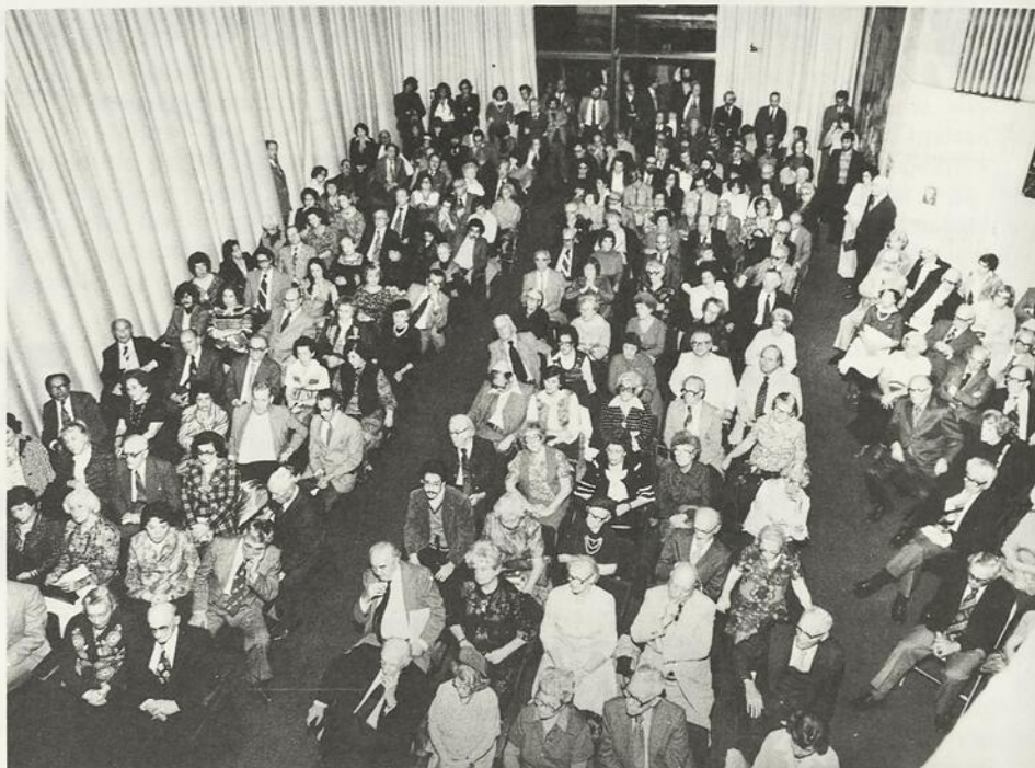
Soirée inaugurale du Mois communautaire du livre juif 1978. Vue d'ensemble de la salle.