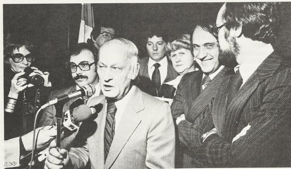
L'hon. René Lévesque

plus grande des victoires d'Israël dans la guerre de Six jours: la libération du Mur des Lamentations et de la cité de David.