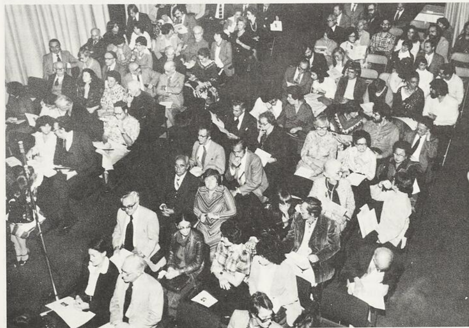
Vue d'ensemble de la salle lors de la représentation de la première des Trois Chants de l'Holocauste.