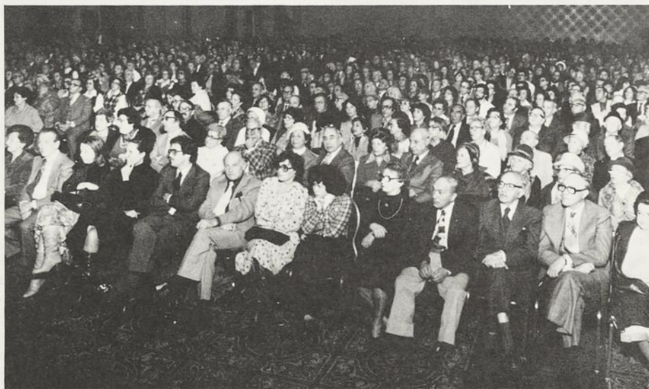
Vue d'ensemble de la salle lors de la conférence donnée à l'occasion du Mois communautaire du livre juif 1978 le 12 Novembre 1978.

Peint à l'acrylique sur toile, le tableau mesure 122 cm carrés.