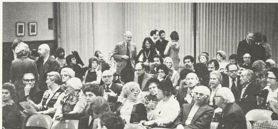
Concert du Mois communautaire du livre juif 1978. Le Congrès Juif Canadien, Région du Québec, en association avec le Temple Beth Sholom de Montréal, présente le Trio Docati.

phonique de Boston. Après cinq années de représentations libres au nombre desquelles figure sa collaboration avec l'Orchestre Symphonique de Montréal, Mlle Prescott se consacre désormais au Trio Docati récemment fondé. C'est aujourd'hui sa troisième saison avec l'Orchestre de Chambre de McGill.