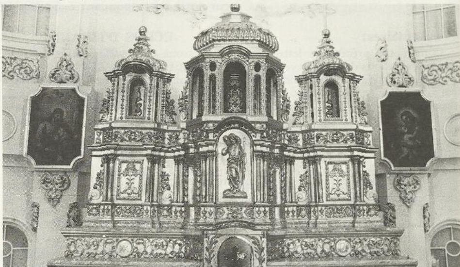
Le tabernacle de la chapelle du Couvent des Soeurs du Bon-Pasteur proviendrait de l'église de Lotbinière. Il est en bois sculpté et entièrement doré à la feuille. Il a été façonné vers 1730 par Pierre et Noël Levasseur. On le retrouve à la chapelle de l'Immaculée-Conception du couvent du Bon-Pasteur en 1879.

Dans l'exécution de ce programme, le ministère des Travaux publics a oeuvré en collaboration étroite avec la direction du Patrimoine du ministère des Affaires culturelles.