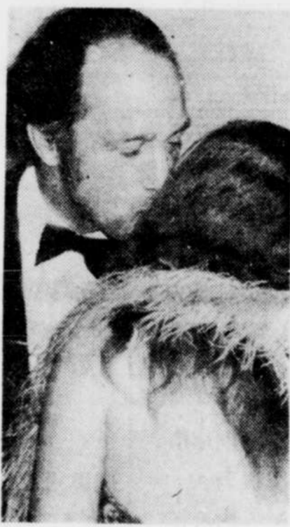
A l'intérieur, le premier ministre, souriant, échange un baiser avec une invitée, au dîner-bénéfice libéral à $50 le couvert.

Le premier ministre a admis que des progrès avaient été réalisés depuis, mais que la société canadienne avait encore beaucoup à accomplir avant de donner l'égalité à la femme, "bien que la société ne saurait attendre la maturité sans la totale participation de la femme".