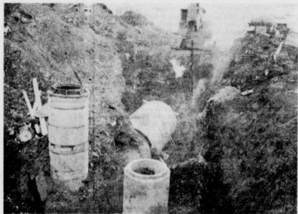
D'IMPORTANTES TRAVAUX d'aqueduc et d'égouts viennent de débiter sur une section de la rue Cowie, à Granby. Des conduites d'égouts pluviaux et sanitaires, de même que d'aqueduc seront installées sur une longueur de quelque 1,600 pieds, pour desservir principalement deux industries de ce secteur, soit Les Roulotres Champlain et les Automobiles Manic. Ajoutons que les égouts résidentiels seront raccordés aux nouvelles installations. C'est la compagnie Lafarge Béton Liée, qui a obtenu le contrat, alors que les plans et devis furent élaborés par la firme d'ingénieurs Lalonde, Tétrault et Associés.