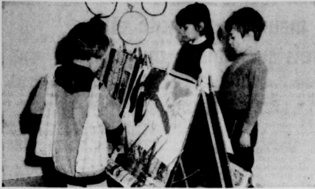
LES ACTIVITES CULTURELLES ont une importance capitale dans les maternelles. Le chant et la peinture sont d'ailleurs des activités qui plaisent beaucoup aux enfants.