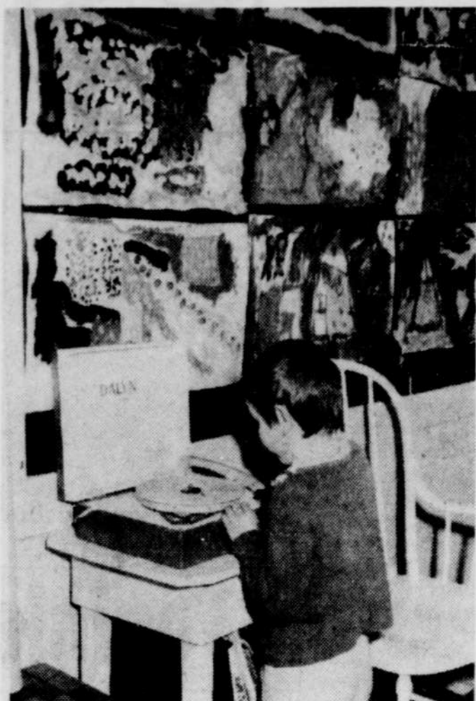
Les jeunes peuvent profiter des moyens modernes pour apprendre à s'émanciper. Le tourne-disque se retrouve ainsi parmi les peintures.

Dans une maternelle, on accorde une grande priorité à l'initiative personnelle et à l'imagination. Il arrive ainsi souvent que c'est l'enfant lui-même qui oriente le travail qui sera accompli en groupe. Le travail part de l'enfant plutôt que de lui être imposé. Il se sent ainsi plus autonome. D'ailleurs, l'imagination et l'autonomie se cultivent.