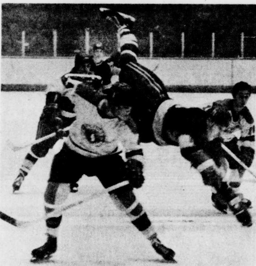
Le Vert et Or a triomphé des Castors au compte de 4 à 1, hier soir, au Palais des Sports devant plus de 3,000 spectateurs. Gerald Lecompte, défenseur des Castors, met en échec, Yvon Robert, ailier du Vert et Or. (Voir photo et nouvelles page 13).