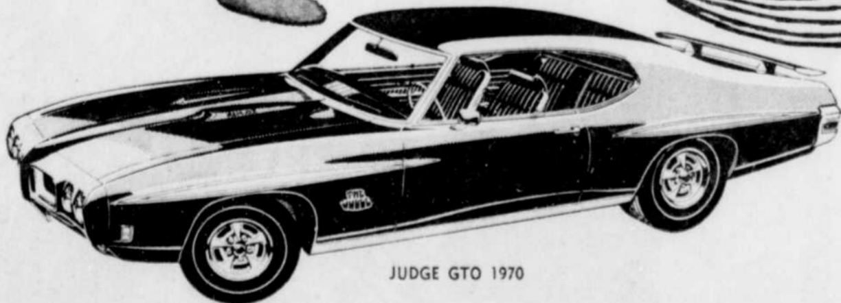
JUDGE GTO 1970

Les Buick 1970, grands modèles et modèles intermédiaires, présentent des innovations de style aussi bien que des améliorations au point de vue performances.