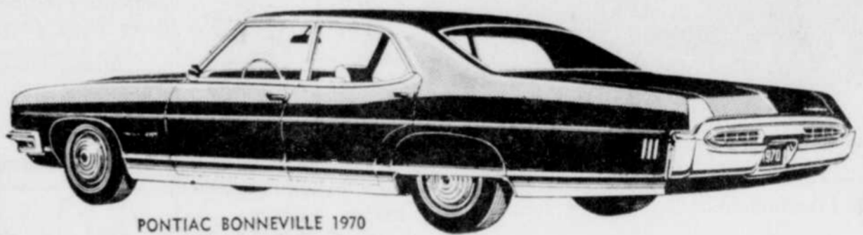
PONTIAC BONNEVILLE 1970 Sedan 4 portières

La plus grosse et la plus luxueuse voiture qui ait jamais porté la marque Pontiac. Garnitures intérieures toutes Morrokide ou tissu et Morrokide. Calandre moulée sous pression, brillante, exclusive. Pare-chocs arrière pleine largeur avec barre horizontale en Endura.