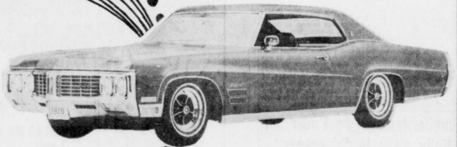
BUICK WILDCAT CUSTOM 1970

Ces prestigieuses voitures offrent les caractéristiques des marques les plus renommées. Grâce à leur haute qualité de fabrication elles sont aujourd'hui en tête de la parade des modèles 1970.