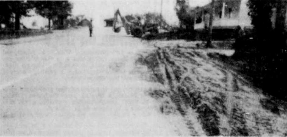
Des travaux d'aqueduc et d'égout sont présentement en cours à Waburn. Ces travaux sont effectués sous les ordres d'un syndicat formé pour solutionner le problème d'approvisionnement de cette localité.

pliqué que l'exclusion des journalistes n'a pas été demandée parce que l'on craignait que les témoignages soient publiés puisque l'enquête se déroule à huis clos. Les reporters ont été avisés qu'il était possible pour eux de demander à être réadmis aux séances mais ils n'ont pas insisté auprès du commissaire Thibault.