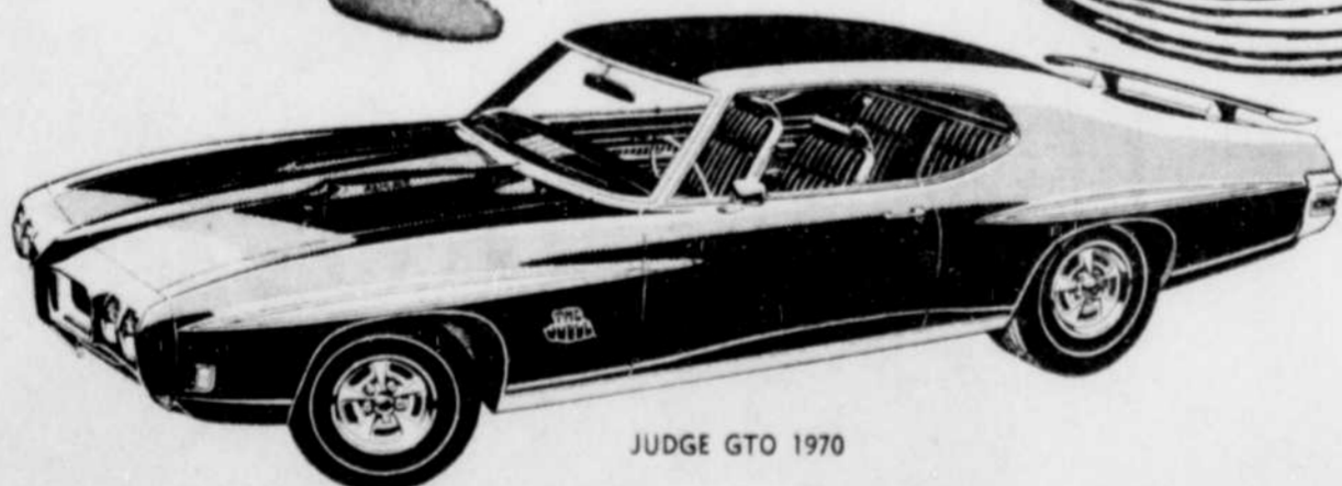
JUDGE GTO 1970

Les Buick 1970, grands modèles et modèles intermédiaires, présentent des innovations de style aussi bien que des améliorations au point de vue performances.