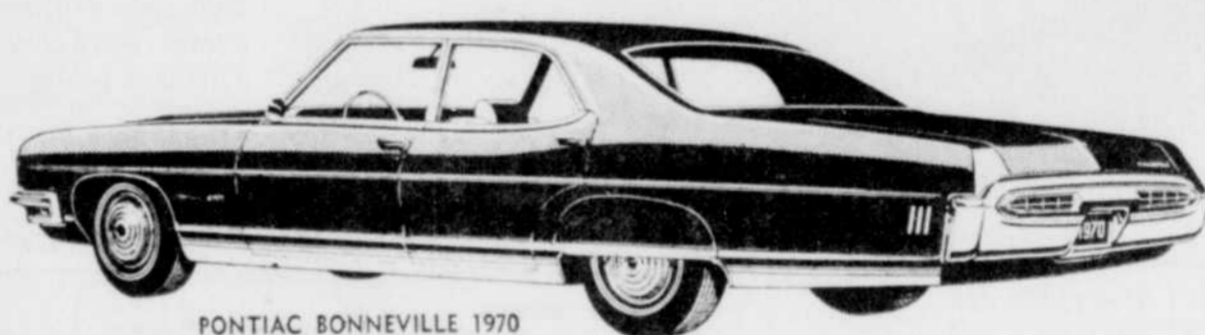
PONTIAC BONNEVILLE 1970 Sedan 4 portières

La plus grosse et la plus luxueuse voiture qui ait jamais porté la marque Pontiac. Garnitures intérieures toutes Morrokide ou tissu et Morrokide. Calandre moulée sous pression, brillante, exclusive. Pare-chocs arrière pleine largeur avec barre horizontale en Endura.