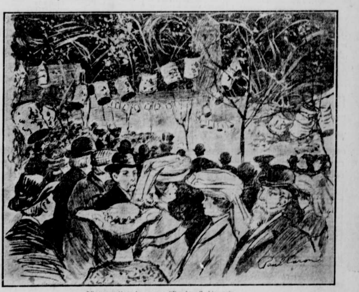
L'inauguration du square "Bumbray", hier soir.

L'inauguration du nouveau Square Bumbray donne lieu à une jolie démonstration -- Deux à trois mille personnes présentes.