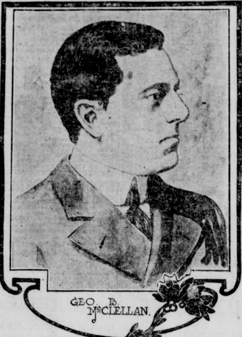
Geo. B. McClellan.

New-York, 4 — Après une lutte remarquable, au cours de laquelle presque tous les journaux et virtuellement tous les ministres de cette ville se sont coalisés contre lui, Geo. B. McClellan, fils du général qui servit son pays pendant la guerre civile, a été élu comme troisième maire de la cité de "Greater New-York" contre M. Low, candidat fusionniste et maire, par l'immense majorité d'environ 70,000 voix.