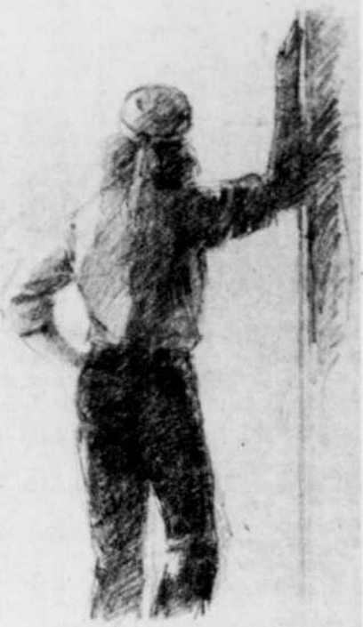
Une étude d'ombres et de lumières pour "Contre jour", une oeuvre de Claude Lefleur.

Le film de Hugh Hudson traduit déjà la dégradation de l'idéal olympique de Pierre de Coubertin. L'atmosphère des Jeux de 1924 est viciée par les dissensions d'alors: Les Etats-Unis, la Grande-Bretagne et l'Italie critiquent vivement la France pour son occupation de la Ruhr. Le public parisien siffle les athlètes américains et anglais. Les incidents se multiplient. "Le monde n'est pas encore mûr pour l'amicale fraternité du sport", écrit le "Times" de Londres, en tirant sur l'échec de l'idéal olympique.