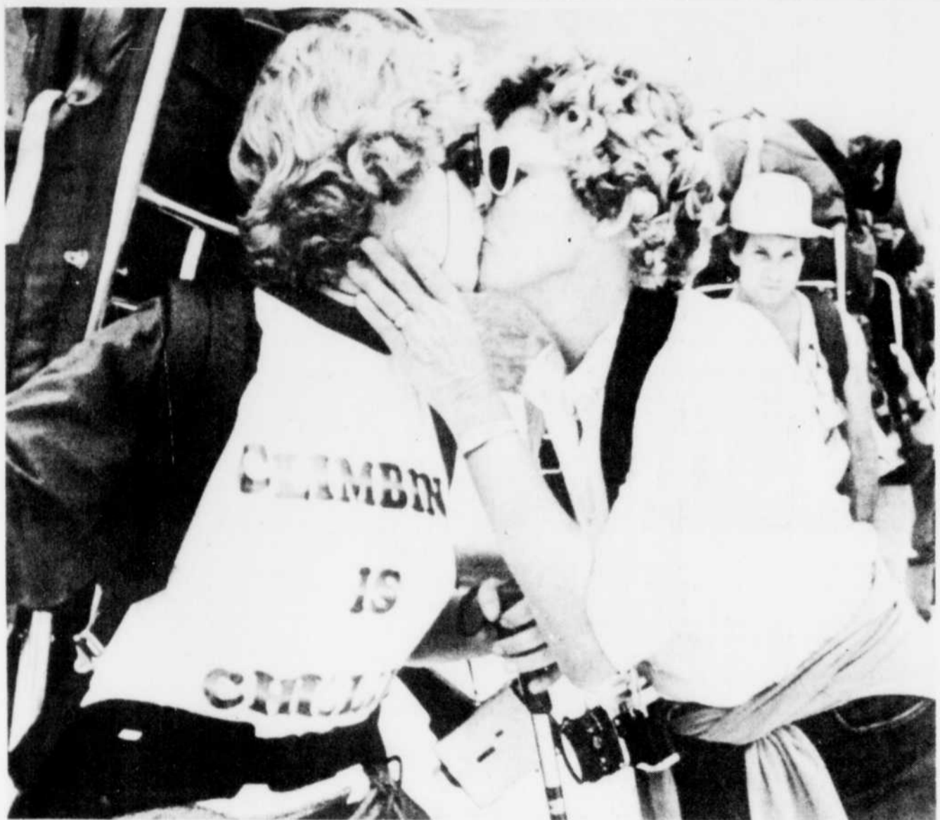
Bonne chance ma fille a dit cette mère à sa fille aveugle quelques instants avant le départ du groupe de personnes handicapées pour la conquête du mont Rainier.

Le directeur du projet a précisé que l'objectif des participants était de détruire l'image restrictive que la société se fait des handicapés.