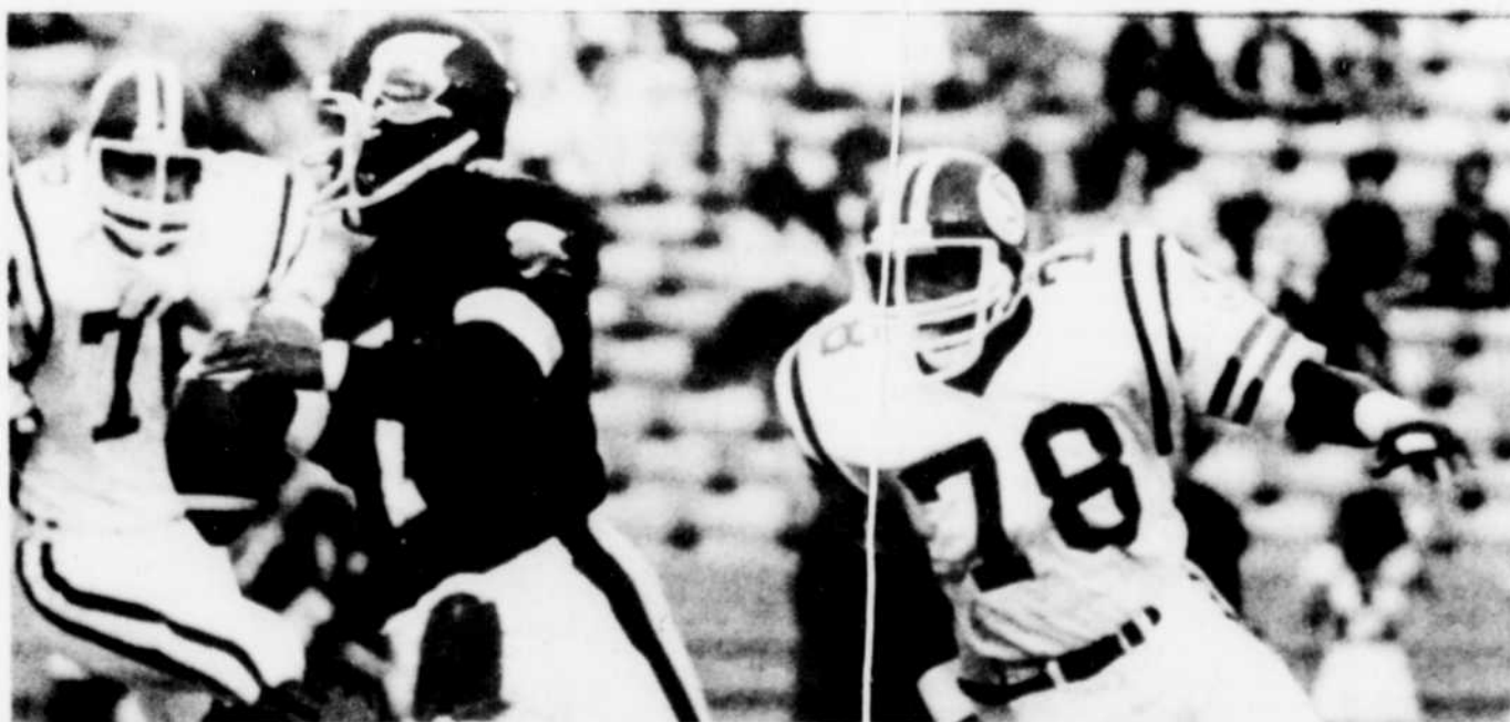
A son premier match régulier dans l'uniforme des Argonauts de Toronto, le quart Condredge Holloway a éprouvé quelques difficultés.

Le botteur Zenon Andrusyshyn a converti les deux touchés, a réussi un placement de 17 verges et a inscrit un simple.