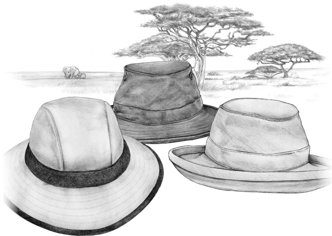
CHAPEAUX DE CHANVRE

Le chanvre vous donne un look très relax. Mais pas pour la raison que vous croyez.