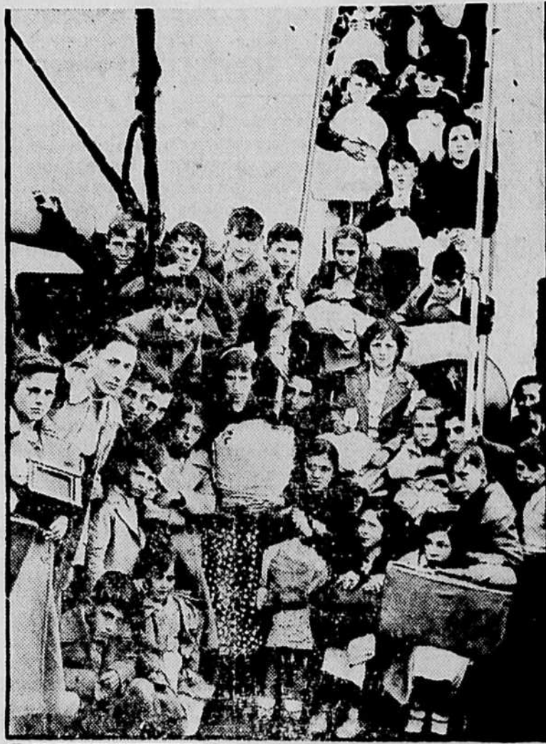
Enfants basques arrivant en Angleterre.

mande à manger, qui demande aussi à donner des caresses. N'est-ce pas? ça vous fait de la peine de savoir comme ils souffrent et comme ils sont désespérés, et ça vous fait du bien de savoir que l'on va pouvoir leur porter du pain. Alors ce pain