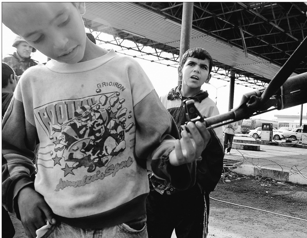
Un jeune garçon examine le fusil AK-47 d'un policier irakien qui supervise la distribution rationnée d'essence dans une station-service de Bagdad.

Les soldats américains menaient une offensive d'un autre ordre à Falloujah, où des unités ont sil-