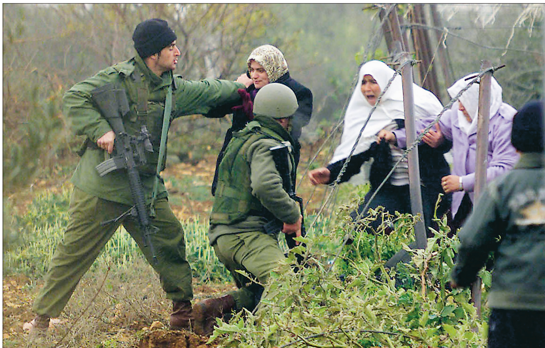
Des soldats israéliens repoussent des Palestiniennes qui tentent de bloquer l'entrée d'un bulldozer (hors photo) sur leurs terres près de Hébron, en Cisjordanie.