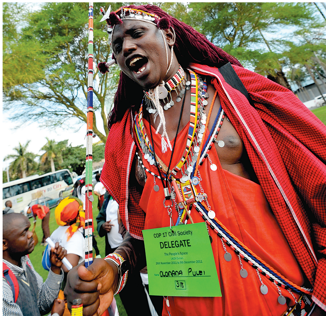
Un délégué prenait part aux manifestations hier alors que débutait la conférence de l'ONU.