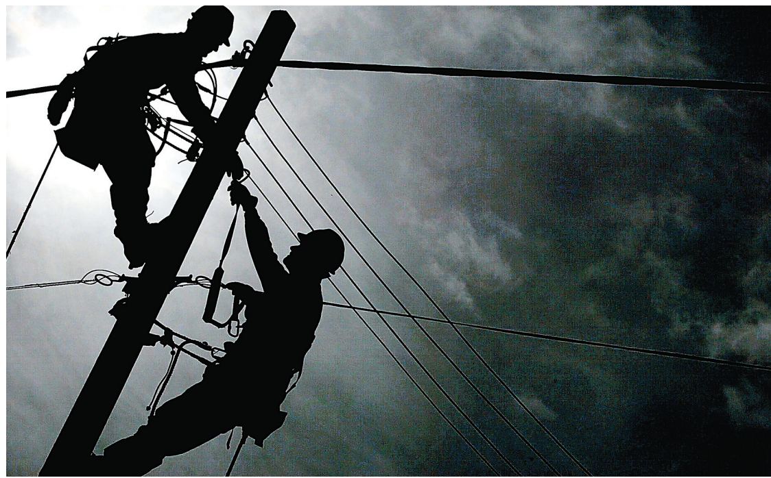
La demande en électricité va doubler d'ici 2050 en Grande-Bretagne.

Avec la collaboration de Louis-Gilles Francœur et d'Alexandre Shields Le Devoir Avec La Presse canadienne